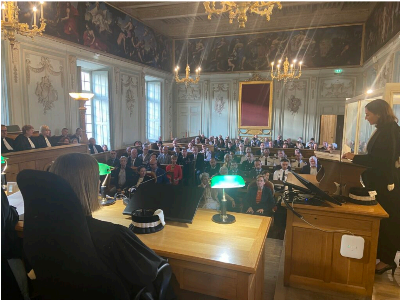
Hélène Mourges (à droite) prononce son discours d'installation

En intégrant le tribunal judiciaire de Carpentras en tant que procureure de la République, Hélène Mourges succède à Pierre Gagnoud nommé en qualité d'avocat général à la Cour d'Appel de Poitiers et qui a occupé les fonctions de procureur pendant six ans. La nouvelle procureure de la République a notamment déclaré : « Je ferais de la lutte contre les trafics de produits stupéfiants mon cheval de bataille ».