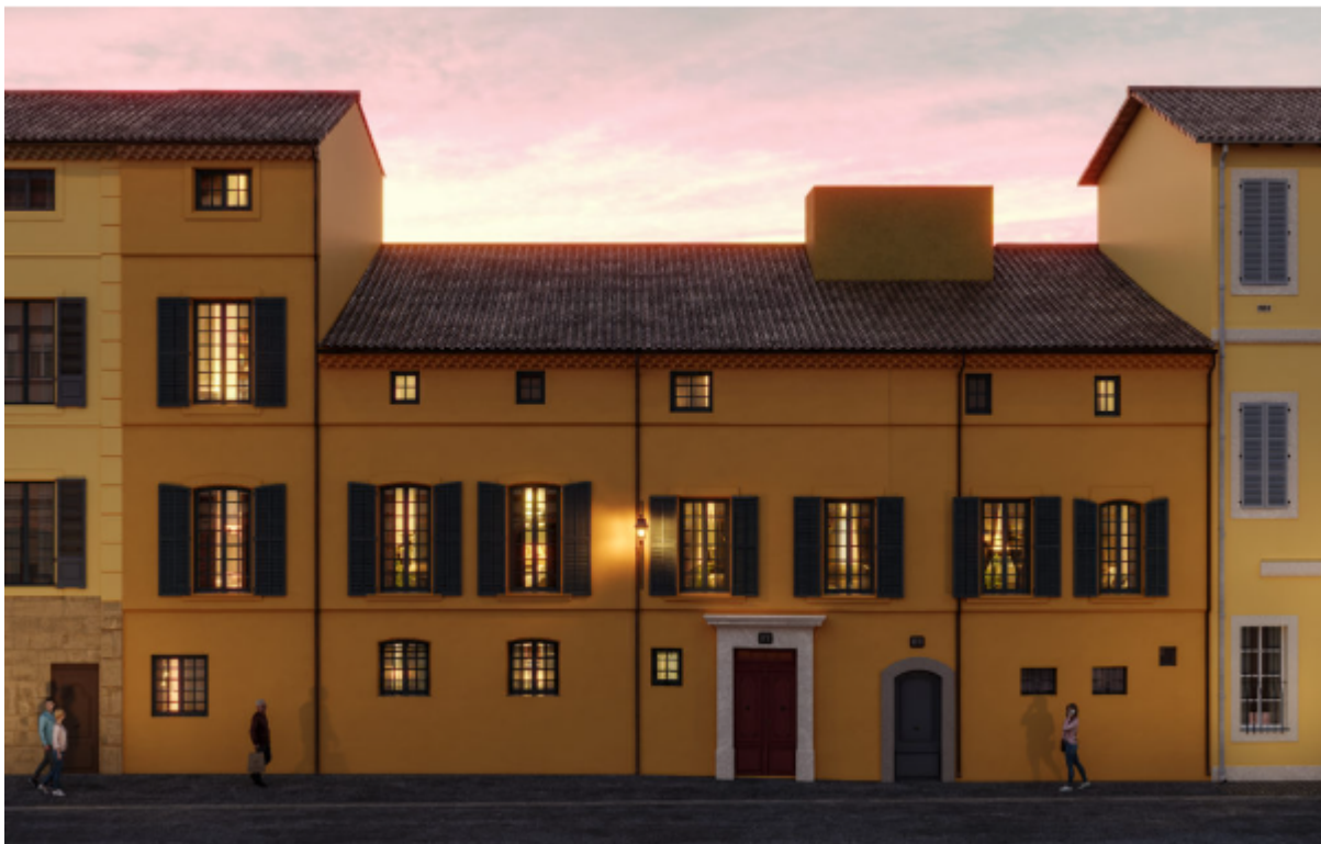
La Salamandre à Carpentras

possédant l'un des plus grands jardins intérieurs du centre-ville historique de Carpentras. Les appartements sont baignés de lumière et les parties intérieures sont sublimes par des parquets versaillais et en point de Hongrie. Des gypseries d'origines typiquement provençales viennent compléter ce décor. La cour intérieure possède une fontaine du XVIIIème siècle qui participe au charme de cette bâtisse. L'Hôtel de la Salamandre est niché dans le centre historique de Carpentras, à 100m à peine de la Porte d'Orange, dernier vestige des remparts entourant la ville jusqu'au XIXème siècle. C'est un dispositif Malraux.