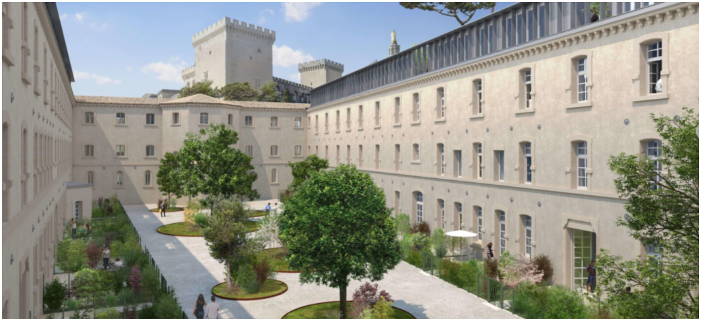
La Cour des Doms