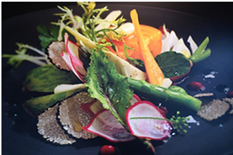
Salade à la truffe d'été