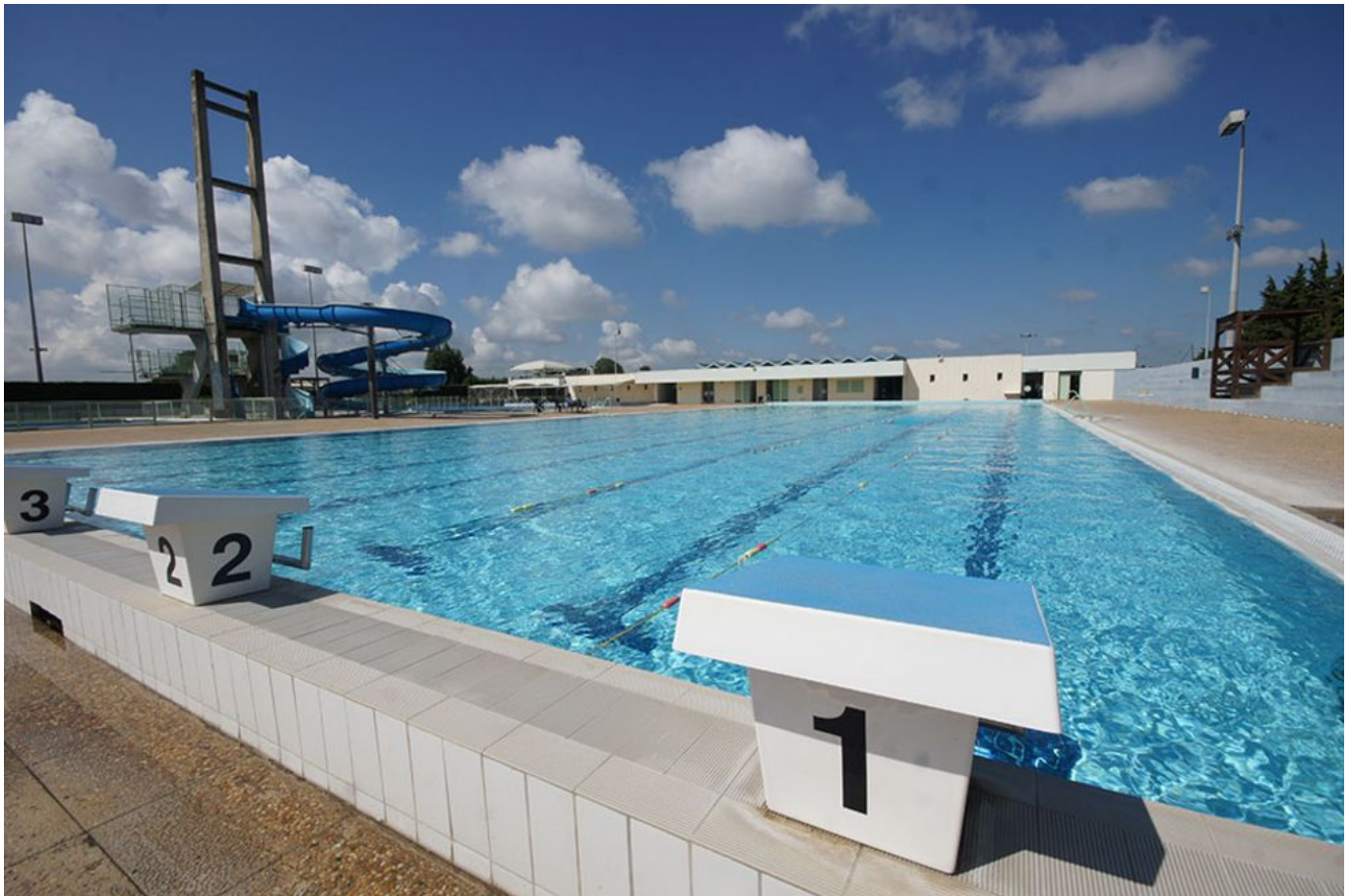
Photo: stade nautique de Carpentras