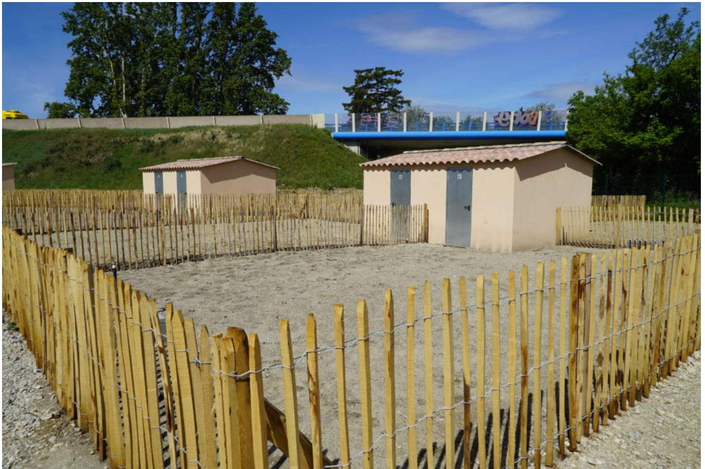
Des parcelles délimitées et un chalet pour le matériel