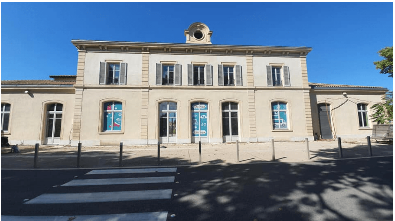
La Gare numérique recherche un collaborateur.

Par ailleurs, la Cove est à la recherche d'un investisseur capable de porter un projet de rénovation/extension de la halle du goût située à la Gare Numérique et de l'exploiter avec pour activité principale la restauration. Toutes les informations en cliquant ici .