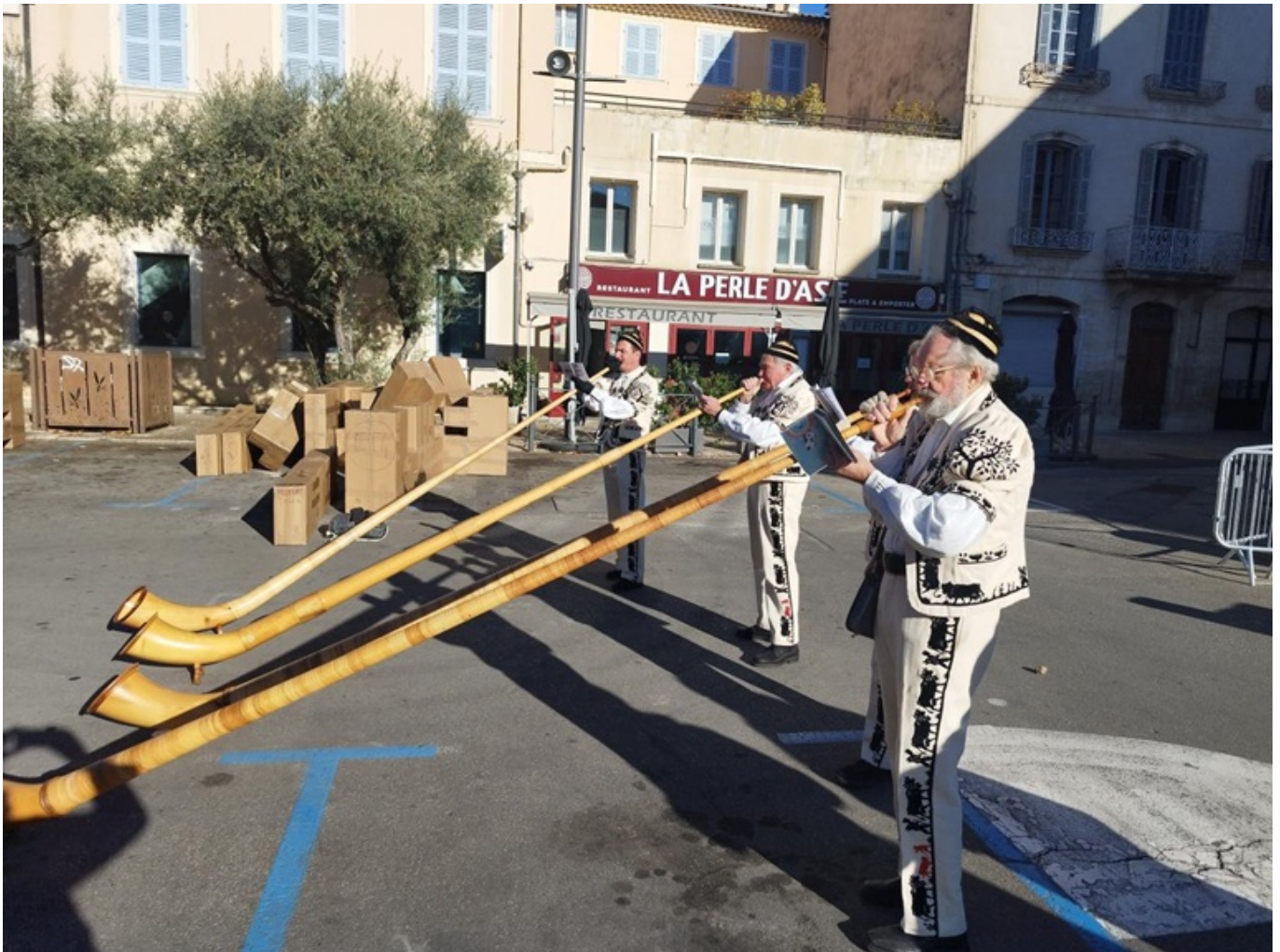
Les musiciens de cors des Alpes ont déambulé dans la ville