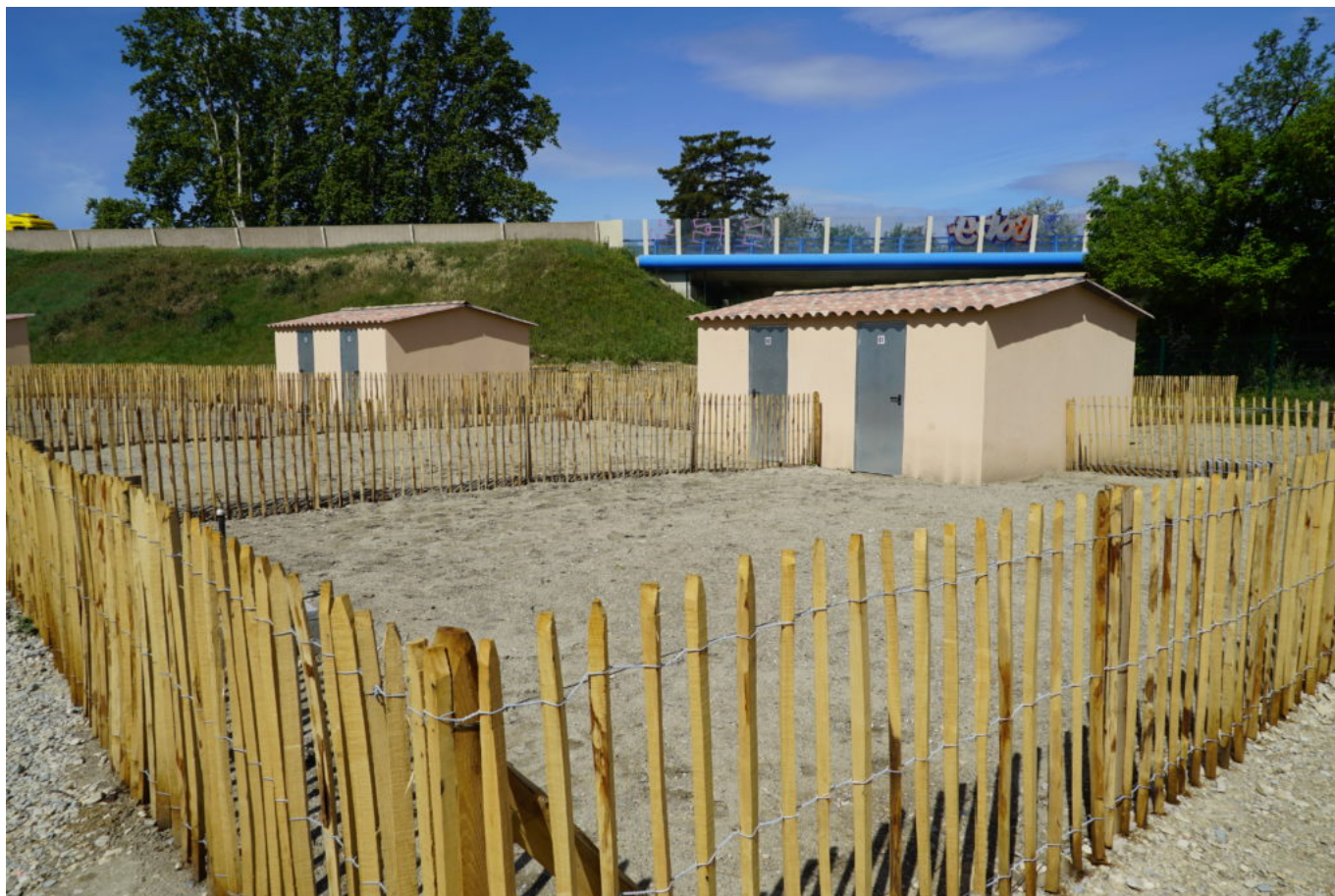
Des parcelles délimitées et un chalet pour le matériel

sélectionnés. Attribuées par tirage au sort, ces parcelles sont désormais prêtes à être semées et offriront bientôt, si la météo ne joue pas la capricieuse, un potager garni. Des framboisiers ont par ailleurs été offerts par la municipalité de Carpentras , représentée par son élu à l'agriculture, Olivier Ceyte , aux mains vertes qui se rêvent déjà en jardiniers de l'année. La Ville envisage également de créer un espace de convivialité d'ici l'an prochain pour que tous les jardiniers en herbe puissent se retrouver et échanger autour des meilleurs pratiques.