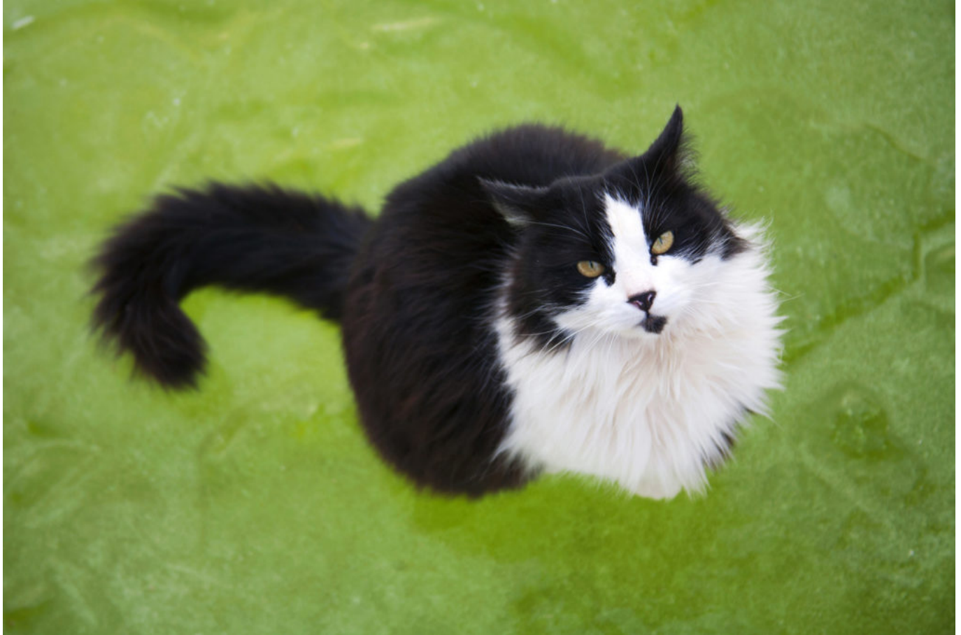
chat assis sur de l'eau gelée / cat sitting on frozen water

serruriers, ferronniers, avant de se spécialiser dans la visserie. « Je changeais d'entreprise tous les 5, 6 ans, pour emprunter d'autres univers et toujours progresser. Ce qui me plaisait ? Etre indépendant. Mon plus grand atout ? Aimer pousser les portes. J'ai toujours eu envie de rencontrer les gens.»