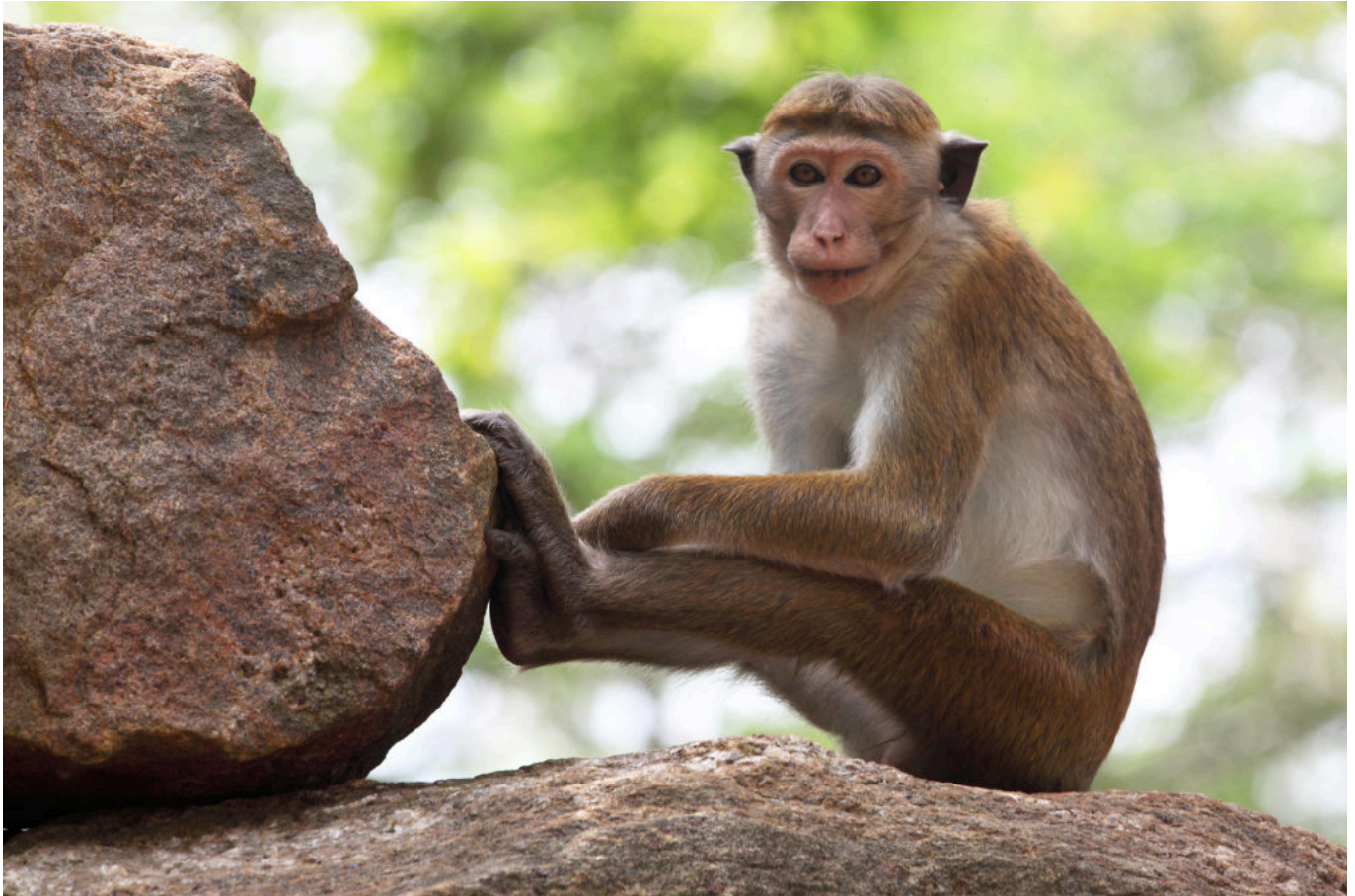
Portrait d'un singe assis