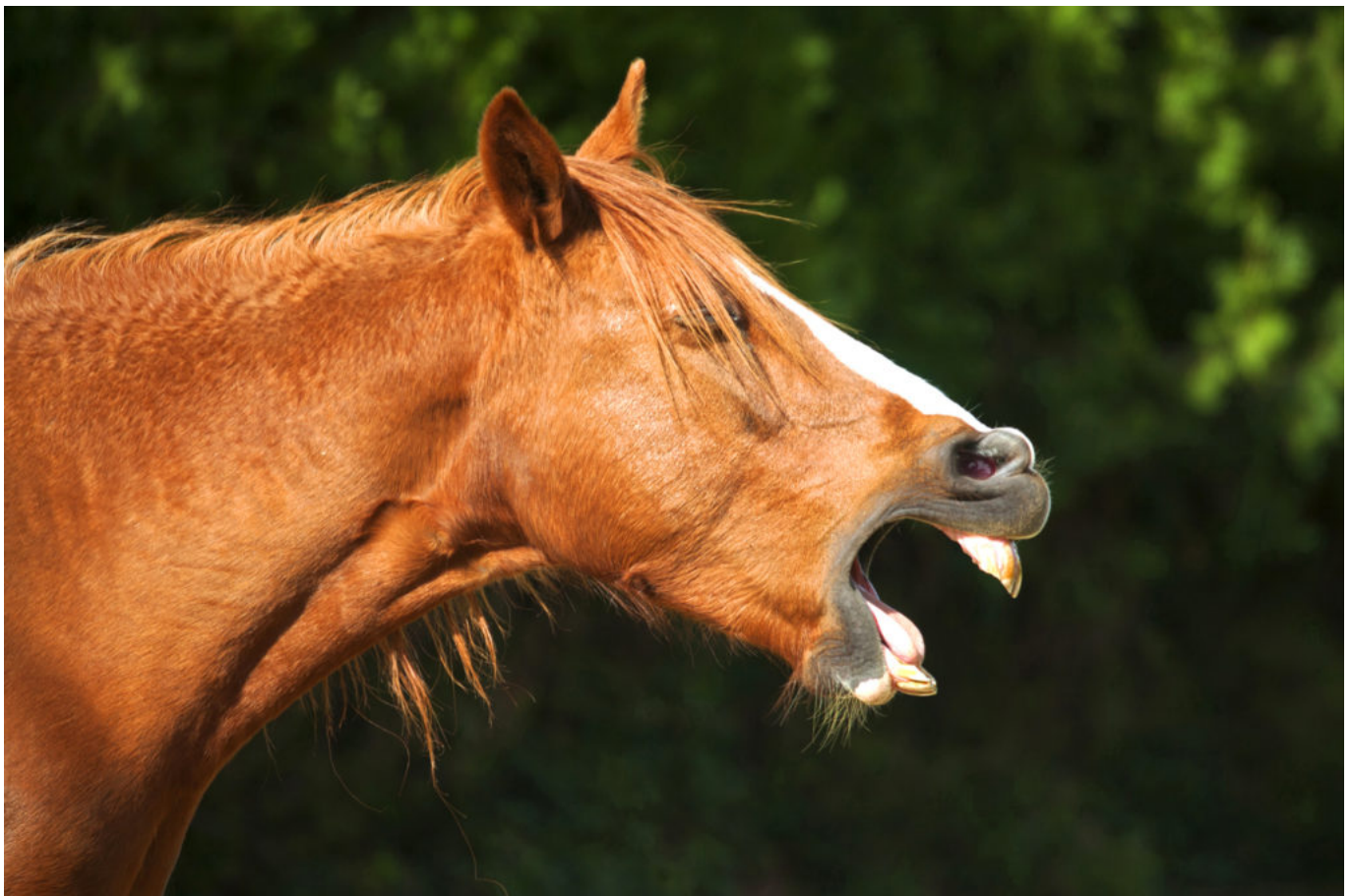
portrait d'un cheval hénissant / portrait of a horse henifying