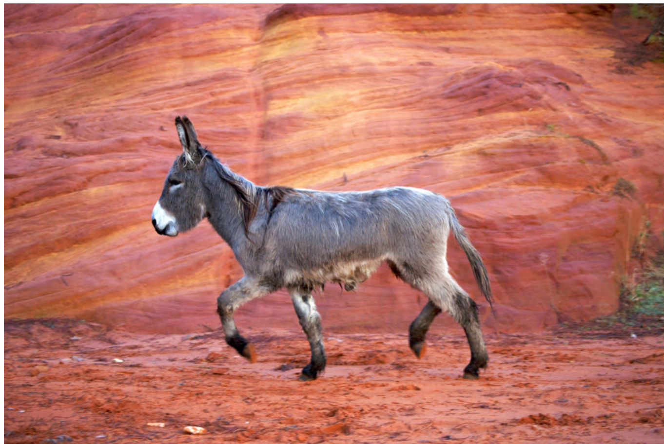
âne dans une carrière d'ocre / donkey in an ochre quarry / Photos © Eric Guilloret