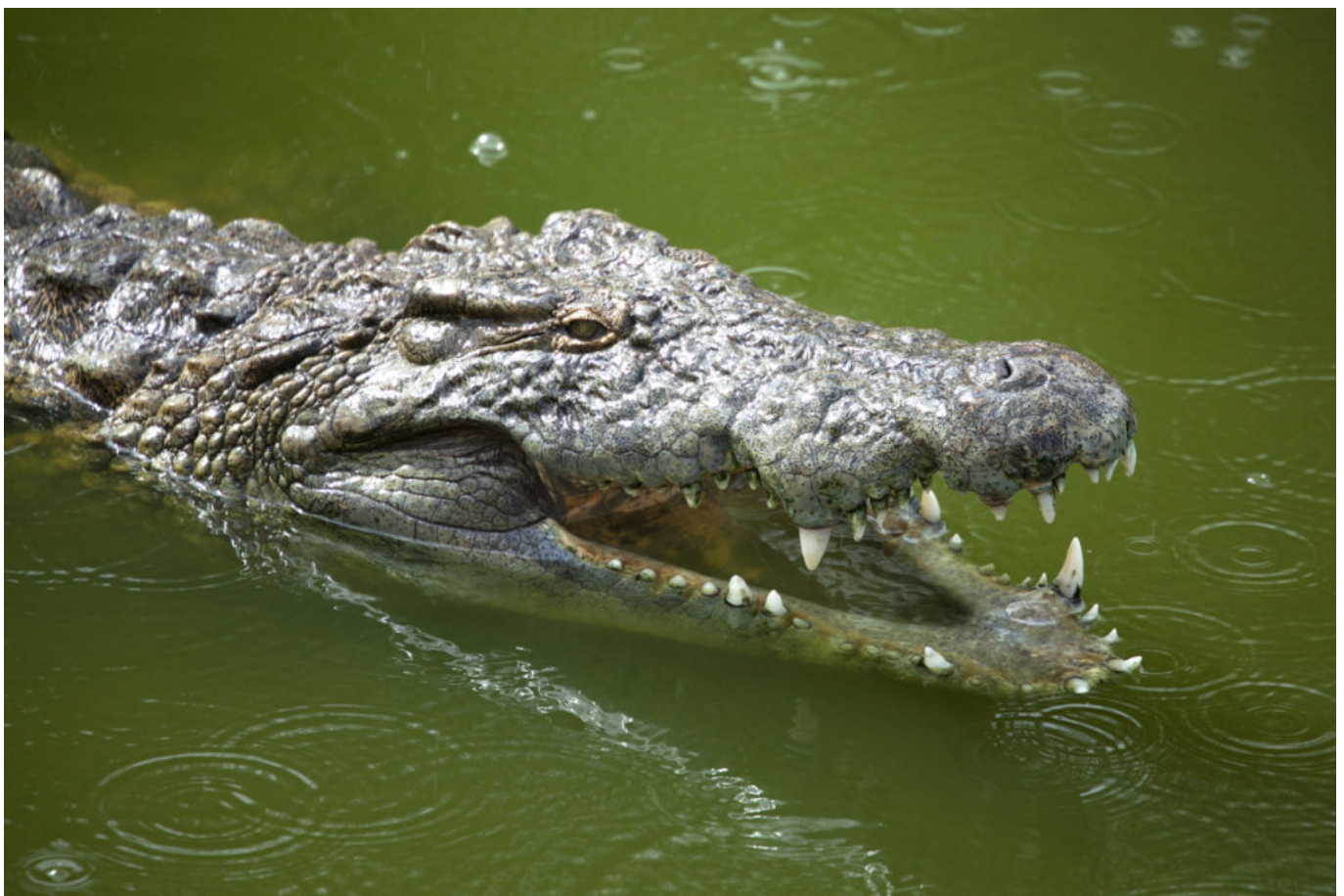
crocodile du nil dans l'eau parc djerba explore tunisie / crocodile of the Nile in the water park djerba explore tunisia

«Je fais du mariage depuis 5 ans, des clients venus à moi par le relationnel. Beaucoup de Belges, d'anglais et de Hollandais. Comment je procède ? Je rencontre les mariés, je leur demande ce qu'ils veulent. Je respecte le cahier des charges : photos de famille, de groupe, signature à la mairie, à l'église. Mais quand ils passent à table, je m'en vais parce que les meilleures photos se font à l'habillage. Maquillage, habillage de la mariée, du marié. Ce sont des journées intenses.»