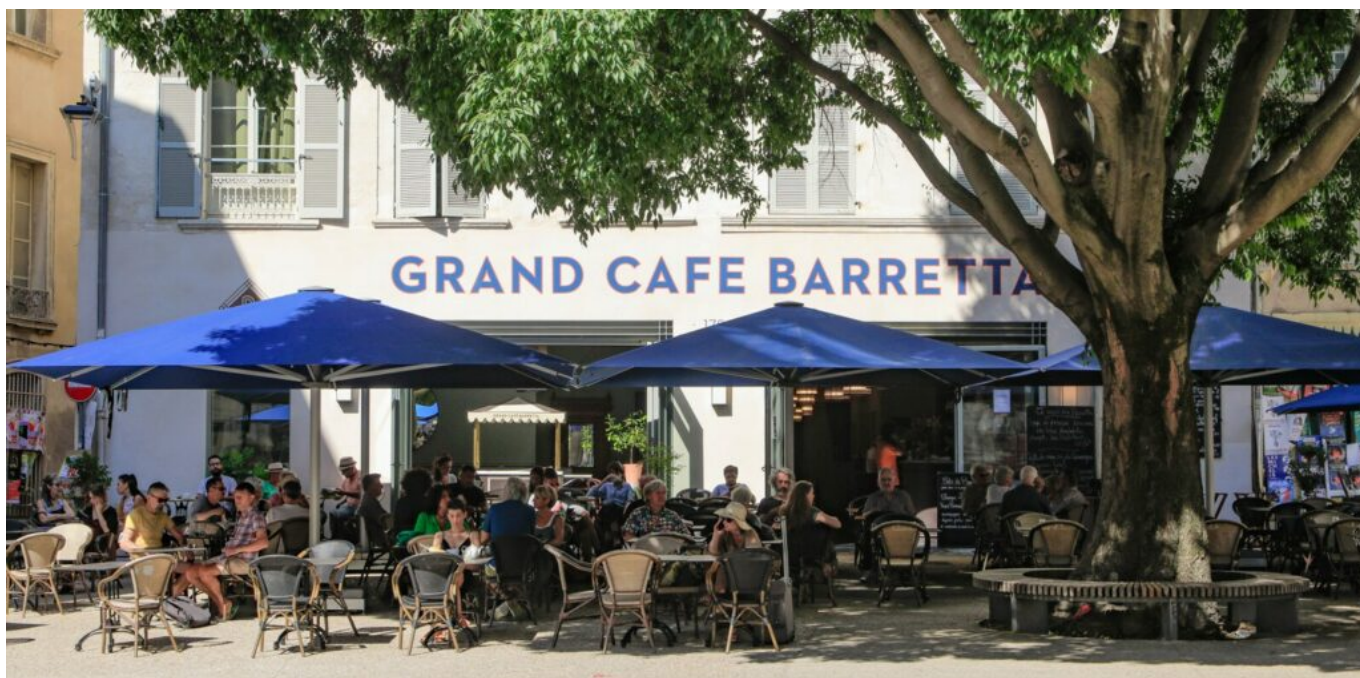
Le Grand Café Barretta à Avignon.

« Cette hyper-concentration reflète la transformation de l'économie locale en faveur de l'accueil touristique, constate ville de rêve. Cette configuration génère des nuisances croissantes pour les habitants (bruits, flux piétons, livraisons, odeurs) et modifie profondément la composition commerciale traditionnelle. »