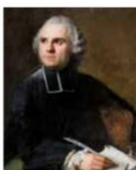
L'abbé François Arnaud (1721-1784). Joseph Siffred Duplessis 1784. Huile sur toile. Carpentras, bibliothèque-musée Inguimberty, inv. 2009.0.3