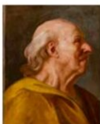
Tête de vieux paysan. Attribué à Joseph Siffred Duplessis. Signé, à gauche : « J. Duplessis pinx ». Huile sur toile. Carpentras, bibliothèque-musée Inguimberty, inv. 873.1.11