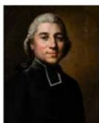
L'abbé de Bouchony. Joseph Siffred Duplessis Huile sur toile. Carpentras, Bibliothèque-musée Inguimberty, inv. 73.12.1