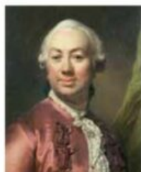
Autoportrait. (Détail) Joseph Siffred Duplessis 1780. Huile sur toile. Carpentras, Bibliothèque-musée Inguimberty, inv. 2009.0.4