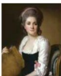
Madame Hue. Joseph Siffred Duplessis 1781 Huile sur toile. Collection Speek-Art, Belgique