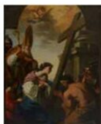
Esquisse pour L'invention de la croix. Joseph Siffred Duplessis Huile sur toile. Carpentras, bibliothèque-musée Inguimberty, inv. 2024.0.1