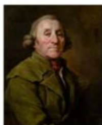
Joseph Péru Joseph Siffred Duplessis 1793. Huile sur toile. Carpentras, Bibliothèque-musée Inguimberty, inv. 886.3.1