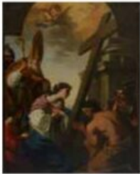
Esquisse pour L'Invention de la croix. Joseph Siffred Duplessis Huile sur toile. Carpentras, bibliothèque-musée Inguimbertyne, inv. 2024.2.1