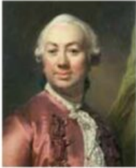
Autoportrait. (Détail) Joseph Siffred Duplessis 1780. Huile sur toile Carpentras, Bibliothèque-musée Inguimbertyne, inv. 2009.0.4