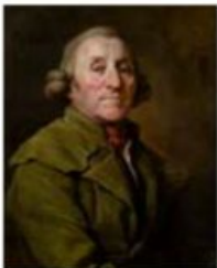
Joseph Péru Joseph Siffred Duplessis 1793. Huile sur toile. Carpentras, Bibliothèque-musée Inguimbertyne, inv. 886.3.1