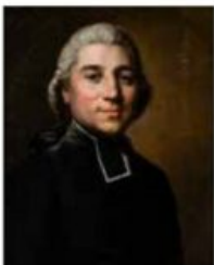
L'abbé de Bouchony. Joseph Siffred Duplessis Huile sur toile. Carpentras, Bibliothèque-musée Inguimbertyne, inv. 73.12.1