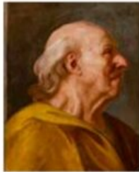
Tête de vieux paysan. Attribué à Joseph Siffred Duplessis. Signé, à gauche : « J. Duplessis pinx ». Huile sur toile. Carpentras, bibliothèque-musée Inguimbertyne, inv. 873.1.11