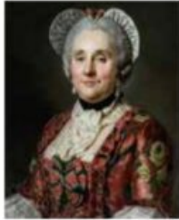
Gabrielle de Raymond de Modène de Pomerol, marquisse de Saint-Paulet. Joseph Siffred Duplessis Huile sur toile. Carpentras, Bibliothèque-musée Inguimbertyne, inv. 525