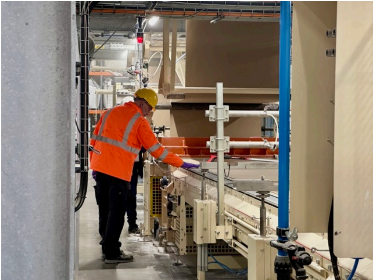
La ligne pilote de Carpentras.