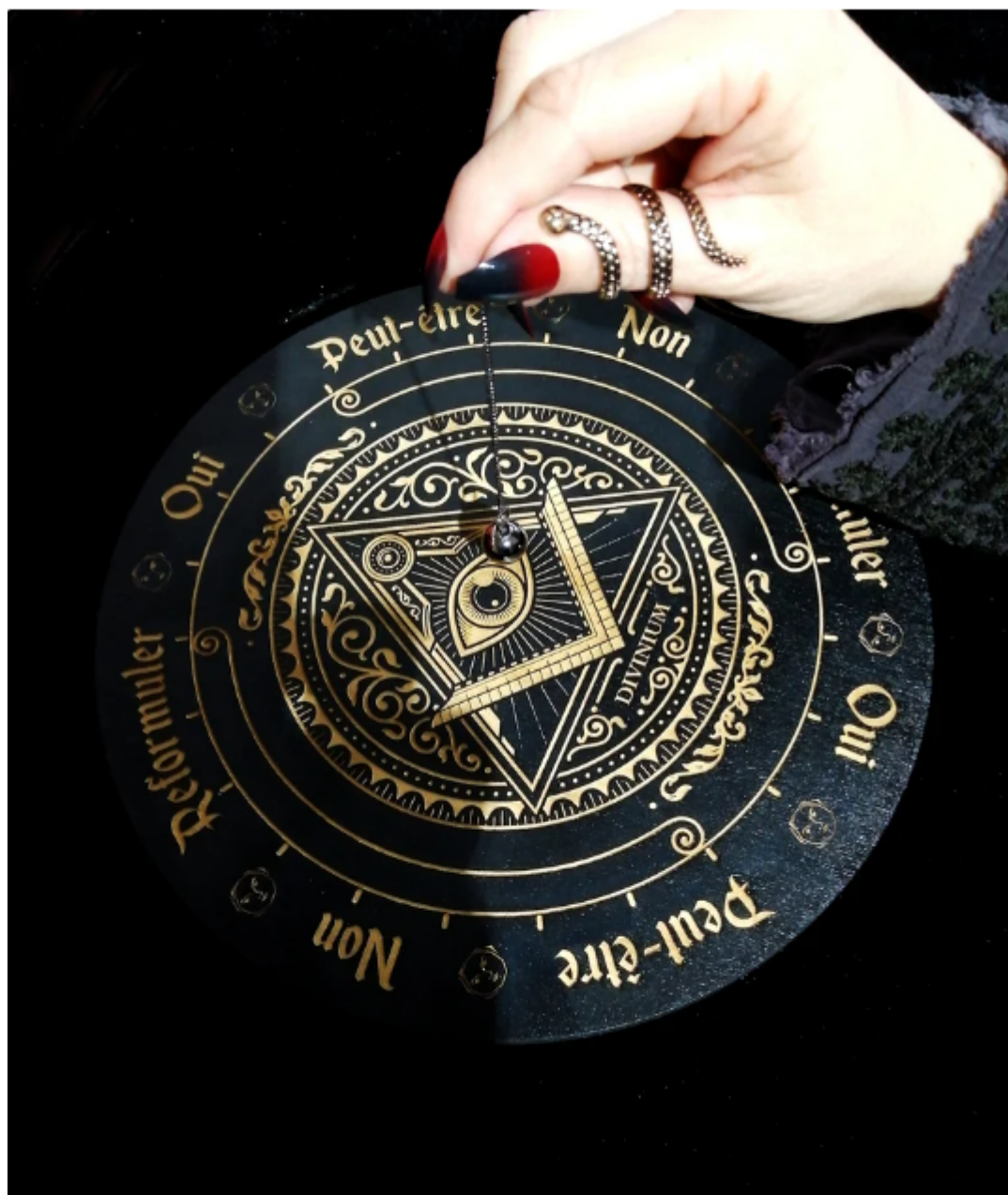
Planche de radiesthésie