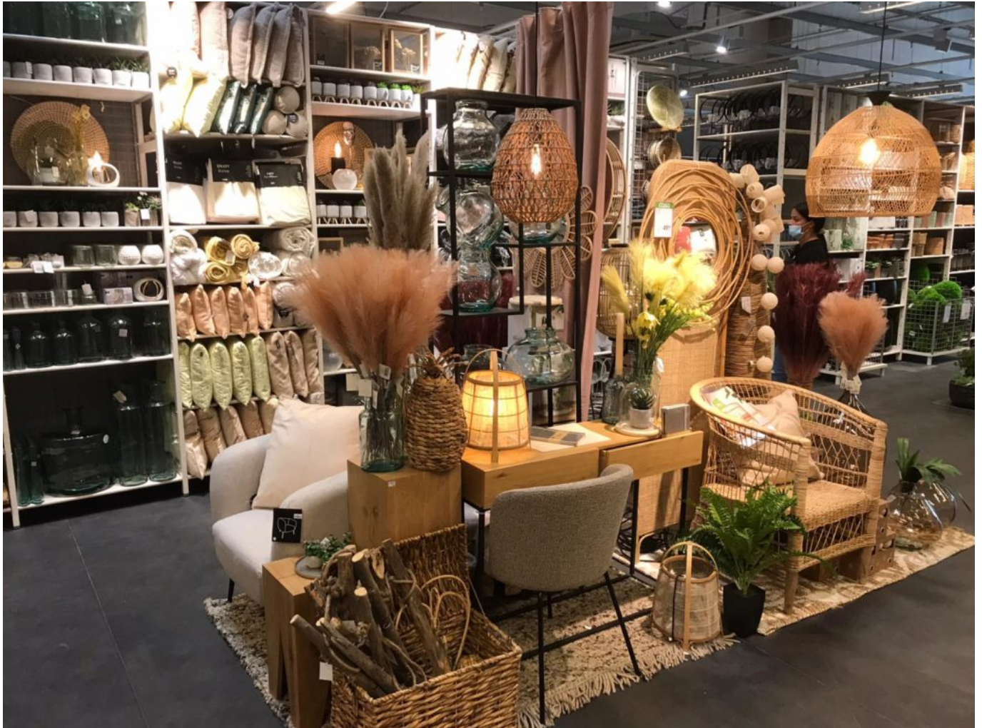
Boutique Casa Vedène.

décoration d'intérieur afin de pouvoir offrir un assortiment constamment adapté pour inspirer et surprendre ses clients. Pour en savoir plus : www.casashops.com