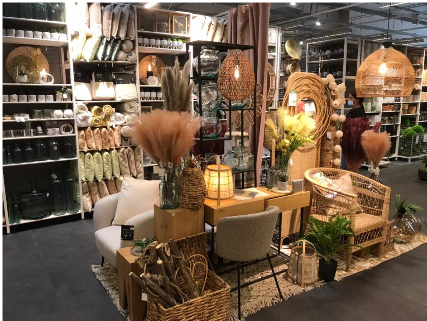
Boutique Casa Vedène.

décoration d'intérieur afin de pouvoir offrir un assortiment constamment adapté pour inspirer et surprendre ses clients. Pour en savoir plus : www.casashops.com