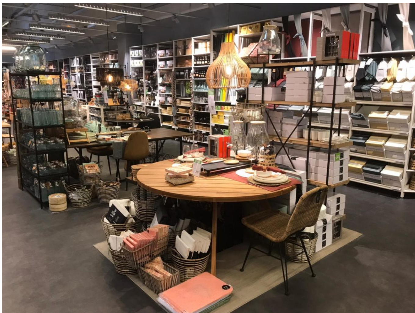
Boutique Casa Vedène.