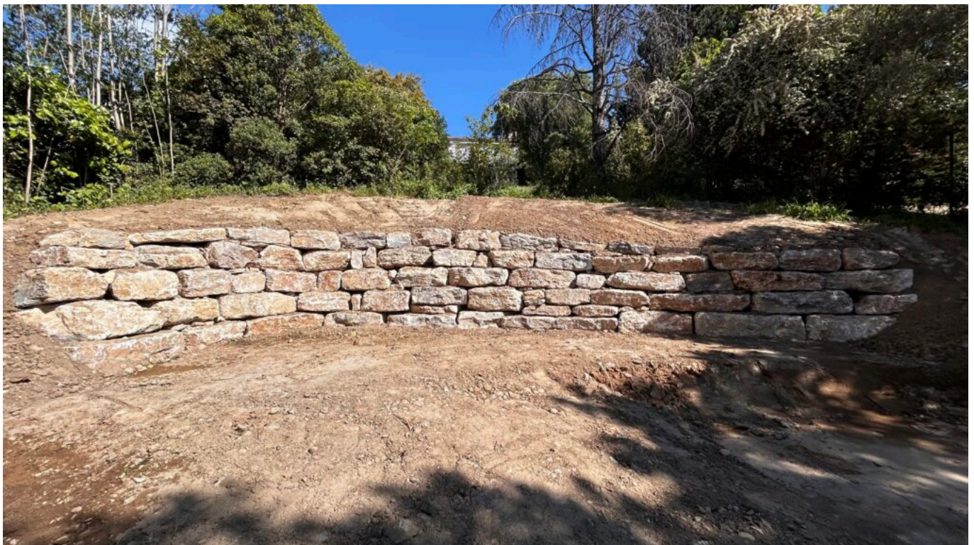
Retenue de terre en pierres

«Les réseaux sociaux ont été mes premiers prescripteurs notamment Instagram et Facebook. Ces outils génèrent d'importants trafics sur notre site Internet, se métamorphosant en relais vitrines en appui à notre site internet.»