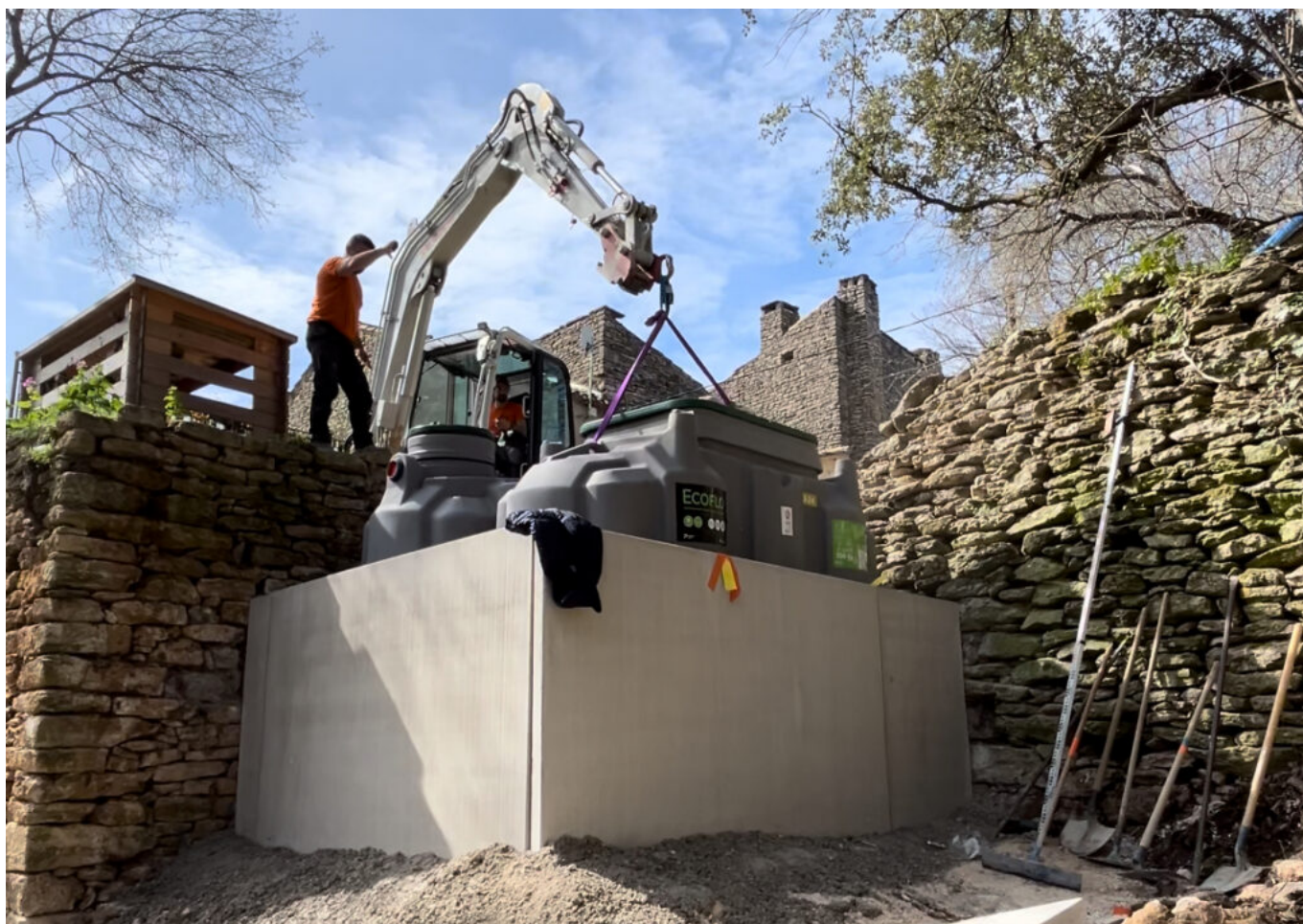
Installation d'une fausse septique