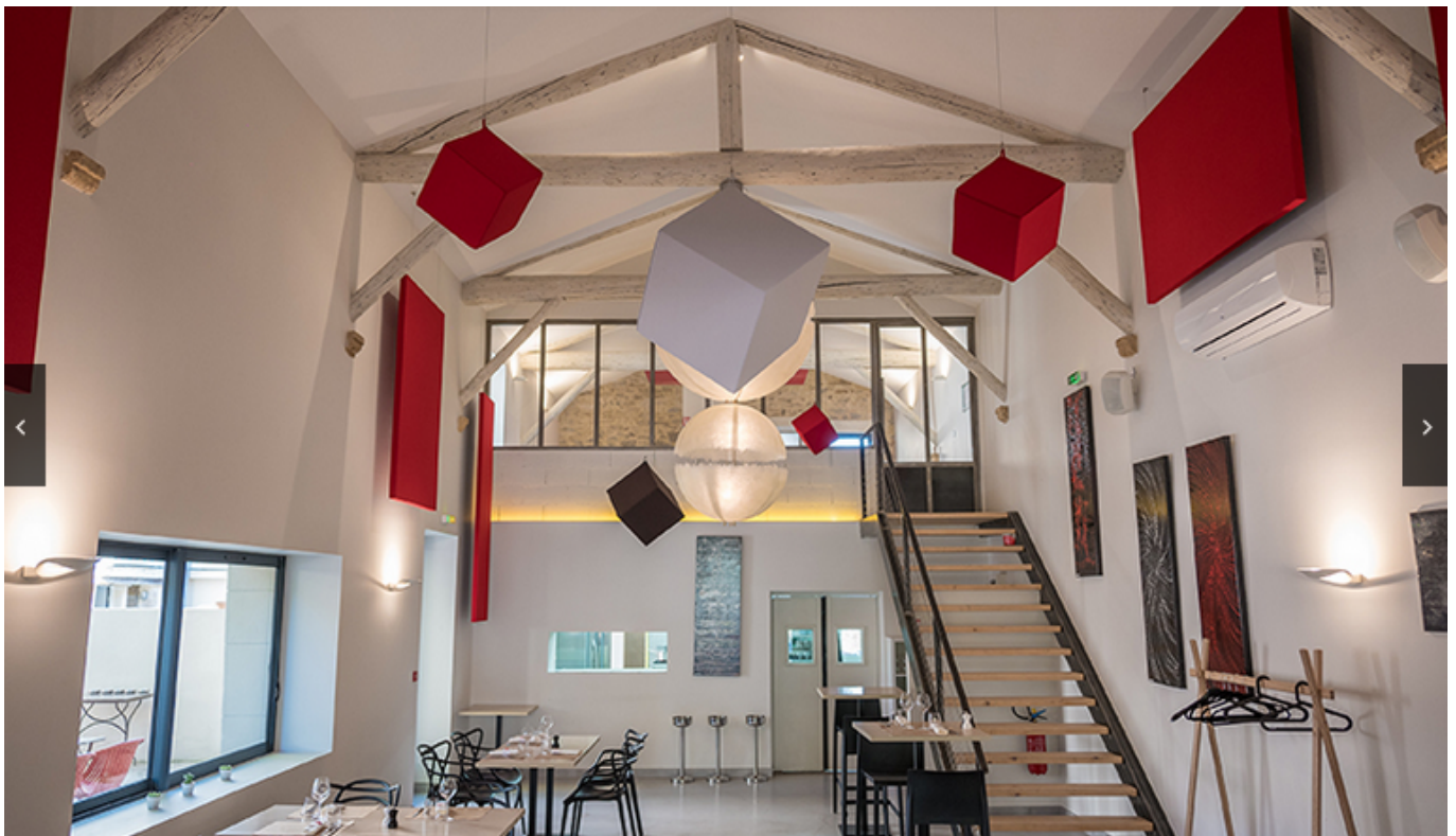
Un espace intérieur de Bleu Vert

«Cela fait 23 ans que nous commercialisons des produits biologiques, principalement auprès de plus de 2 000 magasin bio, relate Maxime Debald . L'adhésion de nos collaborateurs est essentielle parce qu'ils sont les principaux créateurs de nos produits, alors, très logiquement, nous travaillons dans un bâtiment éco-conçu, économe en énergie, avec des postes de travail ergonomiques, dans un environnement naturel et agréable où la faune et la flore locales sont respectées et préservées.»