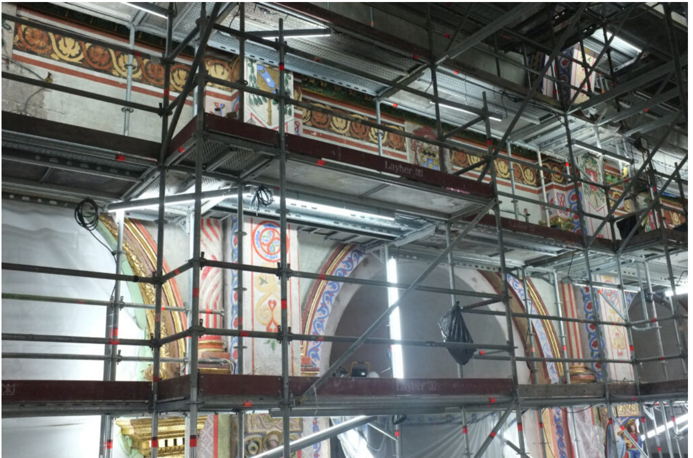
mur peint ©DB