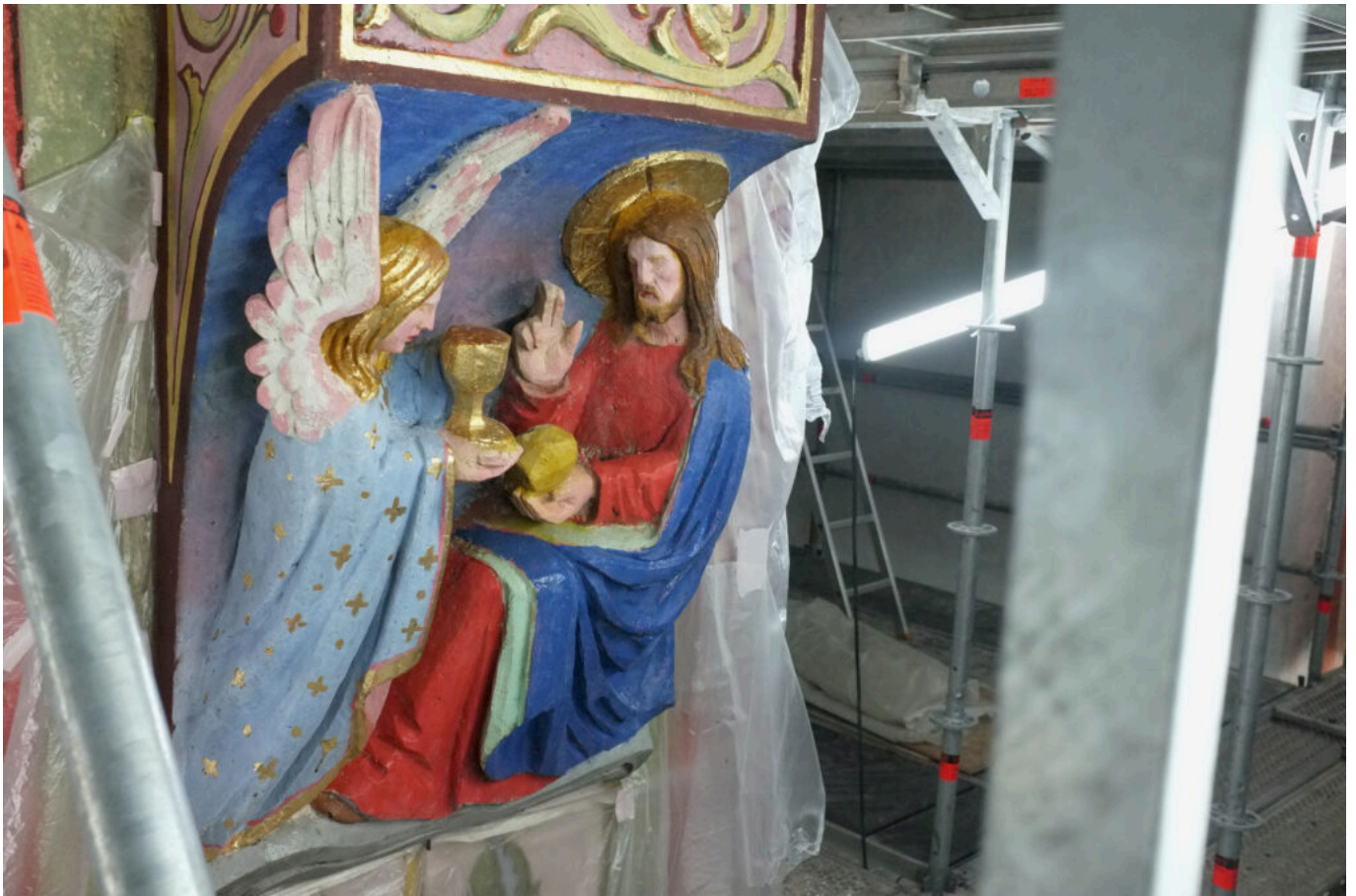
détail sculpture murale