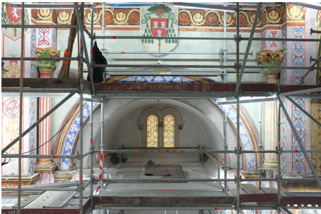
mur peint