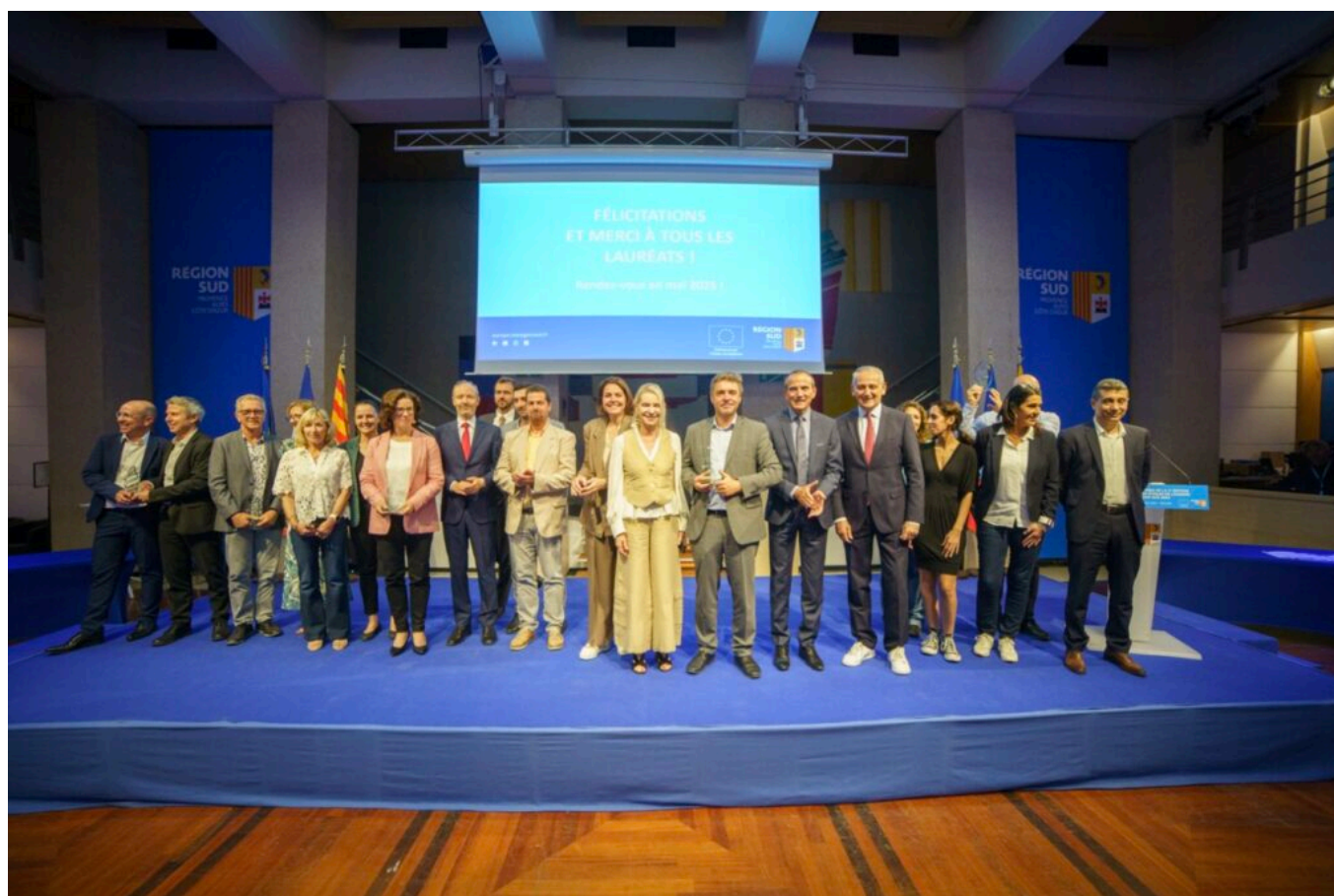
Les lauréats.

Parmi les lauréats cette année, on compte notamment l'exploitation Saint Félix, basée à Cavaillon, qui est arrivée en haut du classement pour la catégorie 'Biodiversité'. Son projet, qui a aussi reçu le Prix spécial du jury, se base sur l'acquisition et l'installation de filets mono-rangs anti-insectes sur ses pommiers, afin de protéger les cultures sans avoir recours aux pesticides, tout en préservant la biodiversité. Le projet présente d'autres avantages tels que la réduction des traitements, de la consommation d'eau, des passages de tracteurs et donc leurs émissions de gaz à effet de serre.