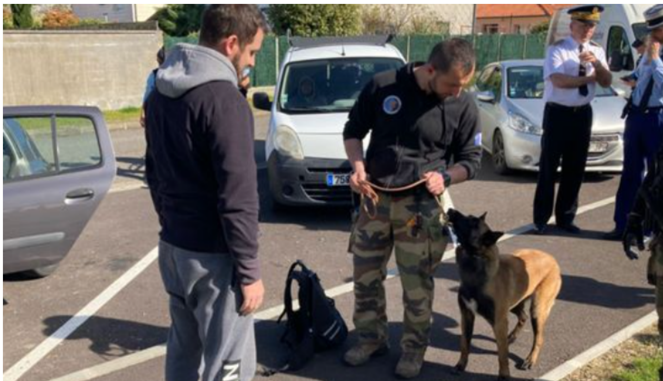
Lutte contre la drogue

Finalement, la lutte contre la drogue n'est pas menée comme elle devrait l'être et comme nous le voyons à Cavaillon, Carpentras -la situation du bois de l'Ubac est catastrophique avec ses guetteurs installés- et à Avignon. Il faut arrêter la politique du bling-bling avec Gérald Darmanin en shérif. Ces solutions ne sont pas opérantes. Les gens qui habitent ces quartiers ont de faibles revenus et ne peuvent habiter que là. Ils sont pris en otages dans une cité contrainte par des trafiquants et où il n'y a plus de services publics. Nous avons besoin de moins d'annonces et de plus d'efficacité, avec l'affectation permanente de policiers. La CRS 8 ? C'est de la rigolade, parce qu'ils ne restent que 4 jours, juste le temps, pour les dealers, d'aller à la mer.»