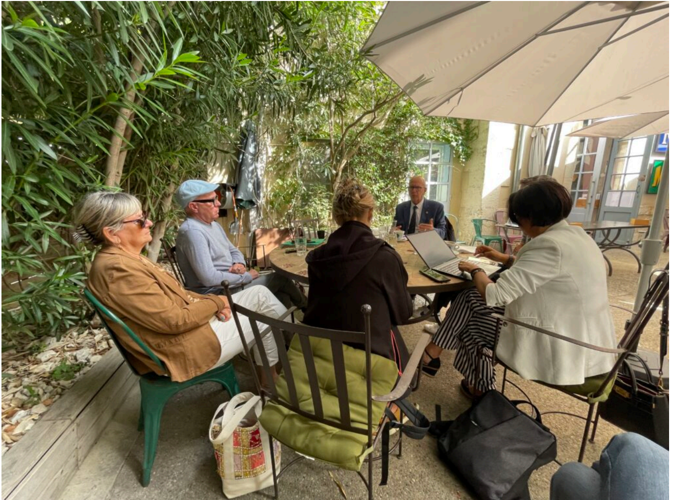
Dans les coulisses de la conférence de presse

pauvres, ainsi que la proposition de la gauche du Smic à 1500€ net. Sur les questions sociétales, également, ils refusent l'inscription du droit à l'avortement dans la constitution. Un député RN a ainsi proposé récemment que les femmes retournent dans leur foyer plutôt que de travailler. Ma ligne de conduite est de travailler avec tous les élus, ceux de gauche et ceux qui se réclament de l'arc républicain au service des vauclusiens et des élus.»