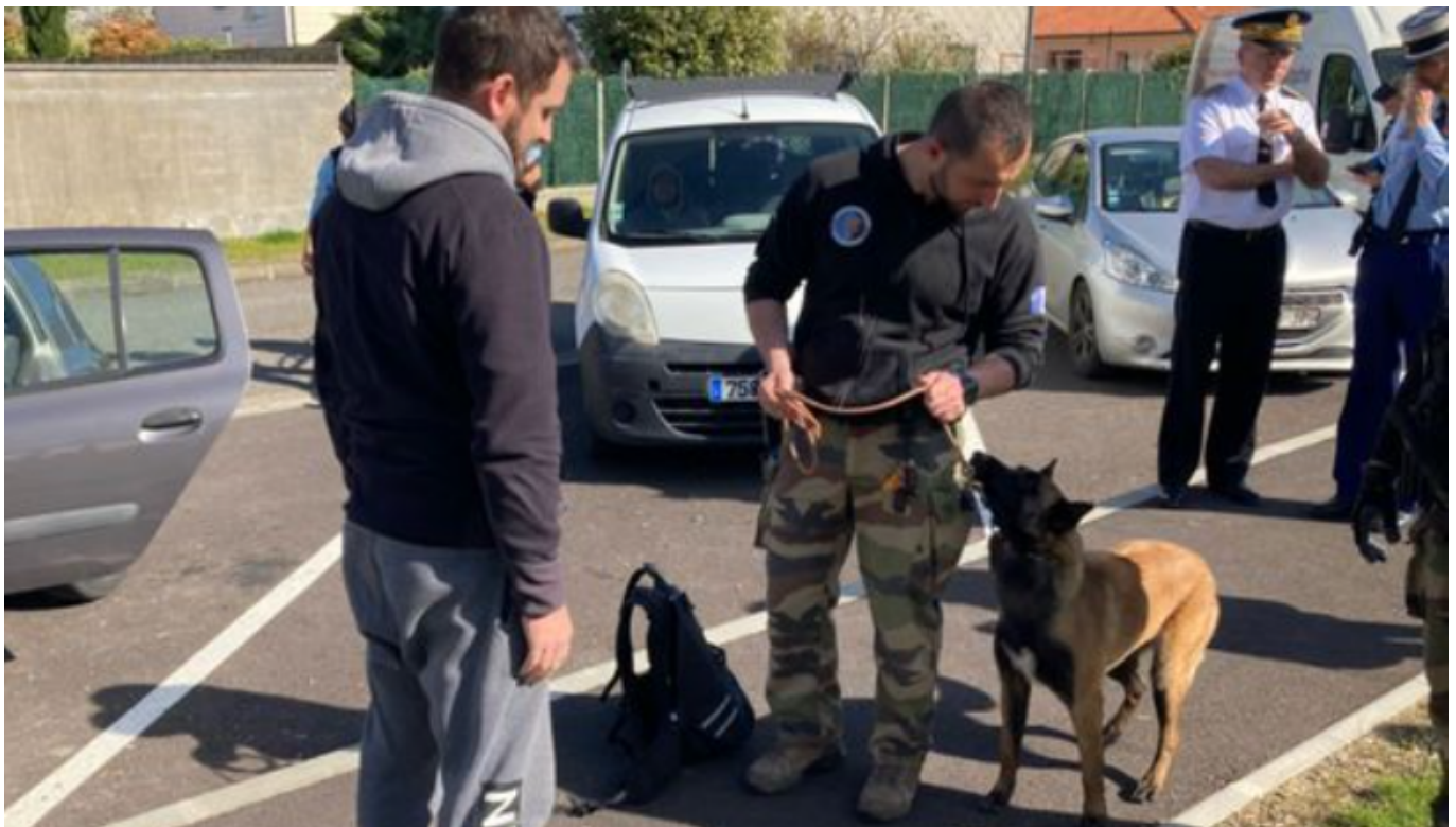
Lutte contre la drogue

Finally, the fight against drugs is not being conducted as it should be and as we see it in Cavillon, Carpentras -the situation of the Bois de l'Ubac is catastrophic with its snipers installed- and in Avignon. It is necessary to stop the bling-bling policy with Gérald Darmanin as sheriff. These solutions are not effective. The people who live in these quarters have low incomes and can only live there. They are taken hostage in a city constrained by traffickers and where there are no more public services. We need fewer announcements and more effectiveness, with the permanent assignment of police officers. CRS 8 ? It's a joke, because they only stay for 4 days, just the time, for the dealers, to go to the sea.»