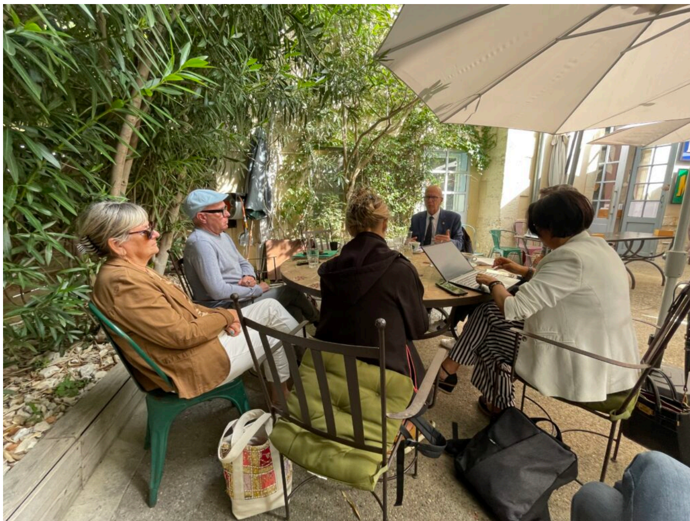
Dans les coulisses de la conférence de presse

pauvres, ainsi que la proposition de la gauche du Smic à 1500€ net. Sur les questions sociétales, également, ils refusent l'inscription du droit à l'avortement dans la constitution. Un député RN a ainsi proposé récemment que les femmes retournent dans leur foyer plutôt que de travailler. Ma ligne de conduite est de travailler avec tous les élus, ceux de gauche et ceux qui se réclament de l'arc républicain au service des vauclusiens et des élus.»