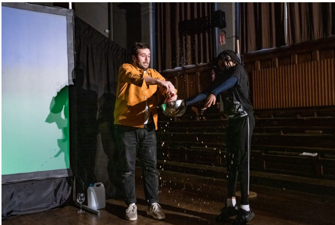
Doublon © Julien Helaine