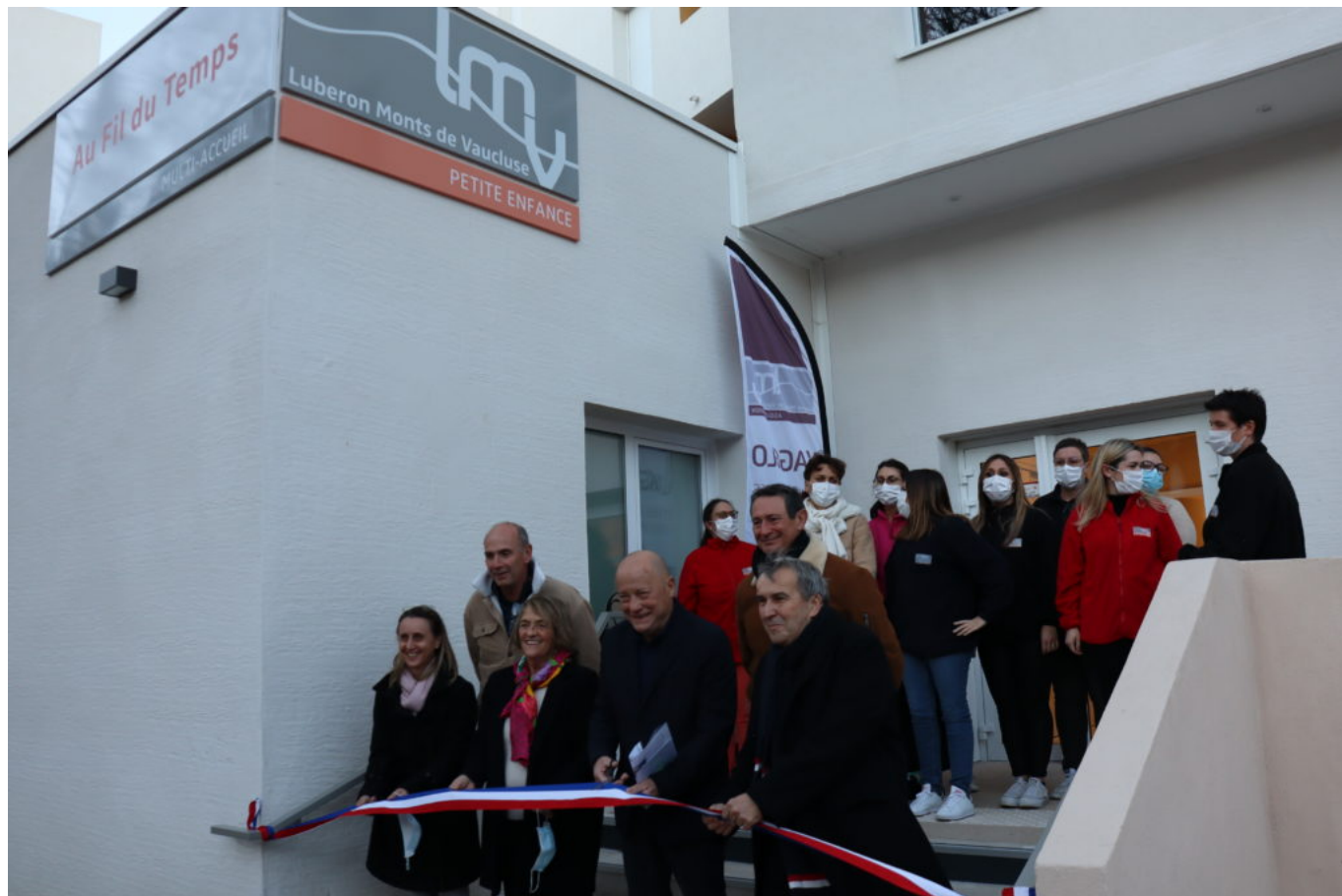
Inauguration de la crèche Au fil du temps.

prévoit un service continu de 7h30 à 18h30, assuré du lundi au vendredi, hors jours fériés.