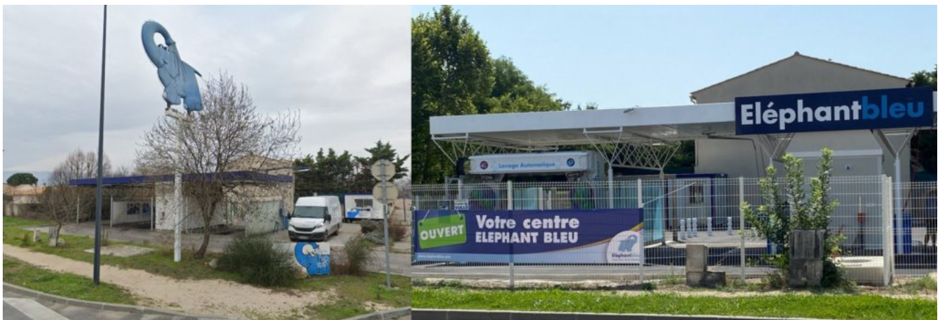
Avant/après. Eléphant bleu de Cavaillon.

« Je suis devenue ambassadrice pour défendre notre métier contre les lavages sauvages qui sont extrêmement nuisibles pour l'environnement. Laver son véhicule dans un centre professionnel permet de gérer durablement la ressource en eau en utilisant la juste quantité d'eau, en captant et traitant les polluants et en utilisant des savons biodégradables », ponctue la nouvelle propriétaire.