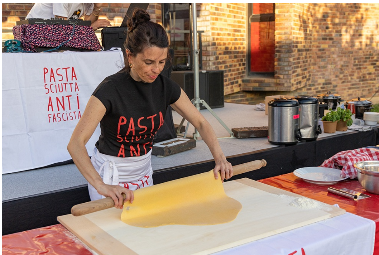
'La Pastasciutta antifascista de Casa Cervi'.