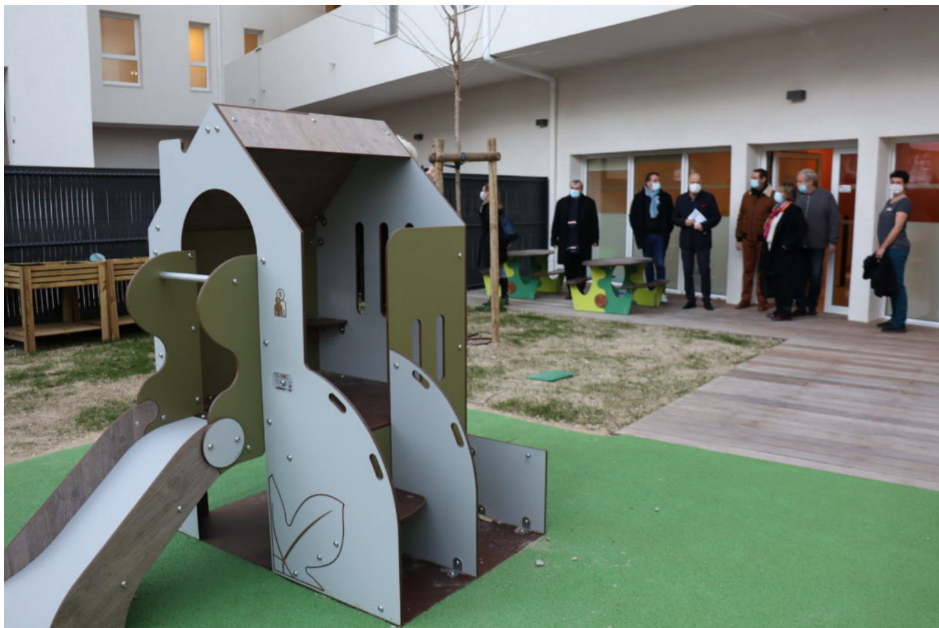
Inauguration de la crèche Au fil du temps.

doté en places de crèches et d'accueil pour la petite enfance. », se réjouit Gérard Daudet , président de l'agglomération. Le nom 'Au fil du temps' se veut un clin d'œil à la passerelle générationnelle qui s'opère en ce lieu.