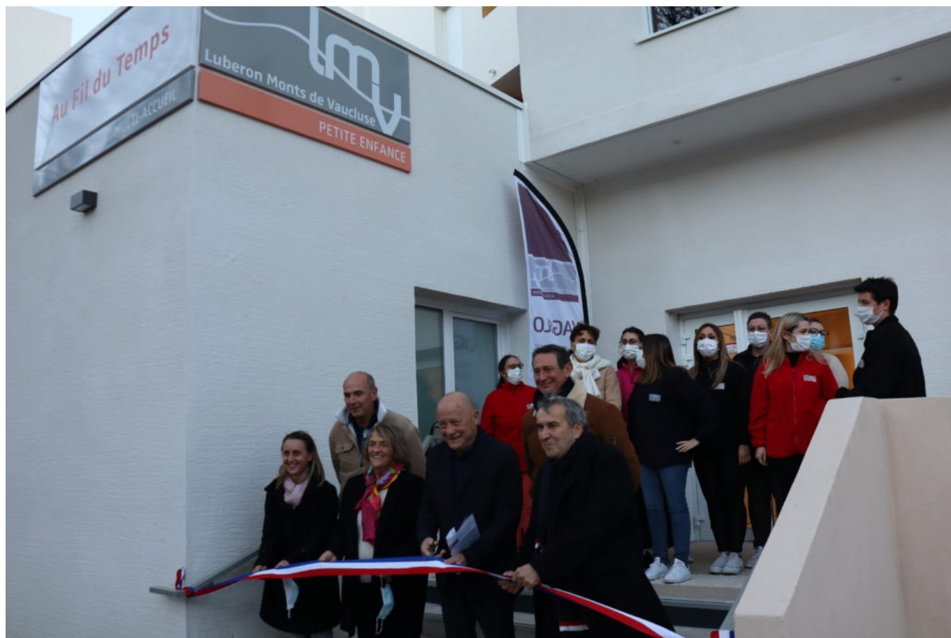
Inauguration de la crèche Au fil du temps.