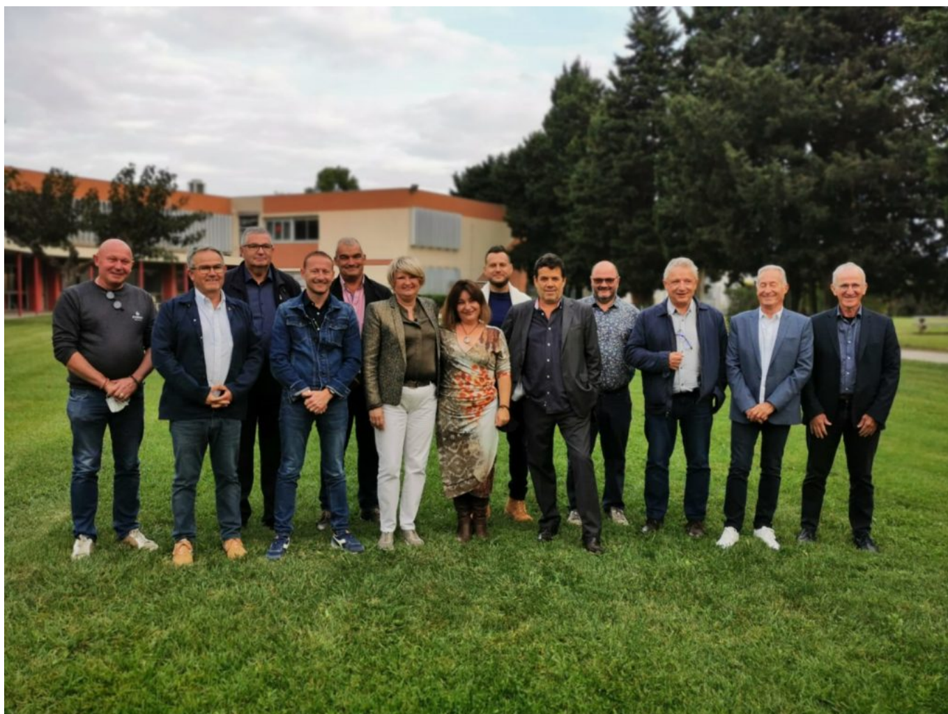
Président, conseil d'administration et direction du Geiq 84