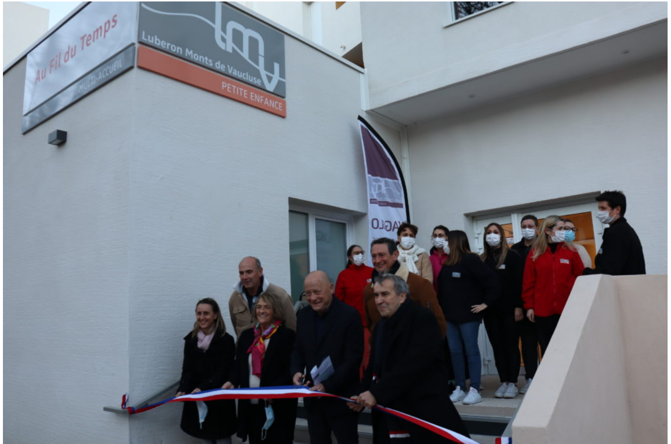
Inauguration de la crèche Au fil du temps.

prévoit un service continu de 7h30 à 18h30, assuré du lundi au vendredi, hors jours fériés.