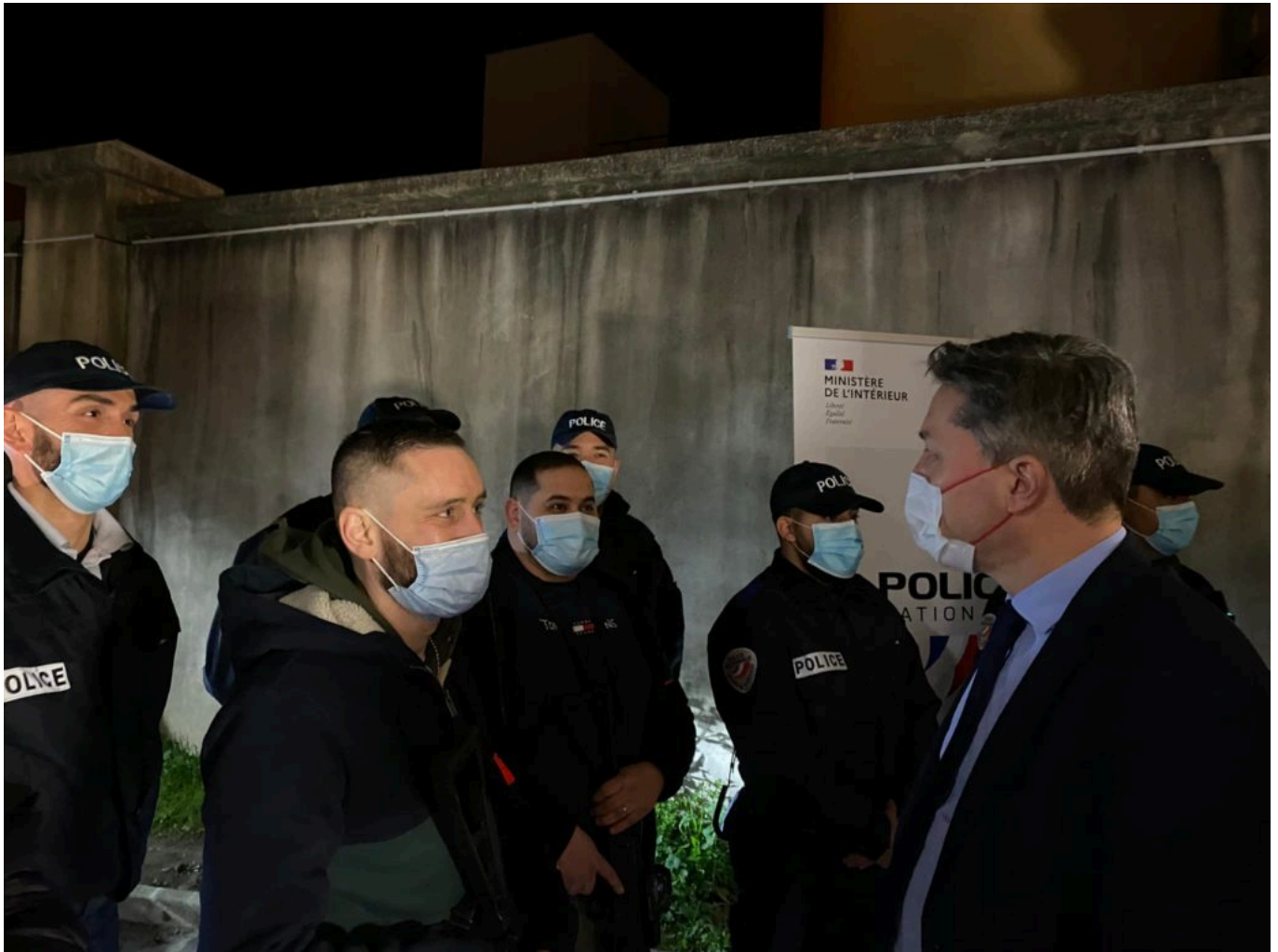
Le préfet de Vaucluse salue les fonctionnaires du groupe de sécurité de nuit à Cavaillon.

la création d'un groupe de sécurité de proximité. Sept mois plus tard, je suis venu les accueillir au commissariat, a commenté le sénateur LR Jean-Baptiste Blanc . Leur arrivée est un acte fort qui nous l'espérons tous permettra le retour de l'ordre républicain à Cavaillon. »