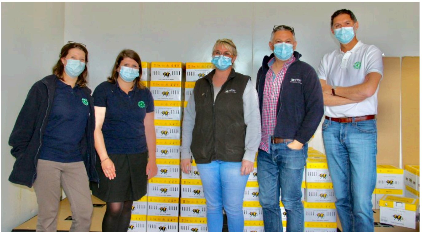
L'équipe logistique est renforcée pour un meilleur service.

Implantée à Cavaillon depuis 1984, le groupe compte 55 collaborateurs en France : 35 personnes basées au siège cavare et dans ce nouvel entrepôt logistique, ainsi qu'une vingtaine dans ses agences d'Agén, de Nantes et de Villeneuve l'archevêque dans l'Yonne. La filiale française a réalisé un chiffre d'affaires de 15M€ l'an dernier. Le groupe Koppert regroupe plus de 1 700 salariés pour un chiffre d'affaires monde de 265M€ en 2019.