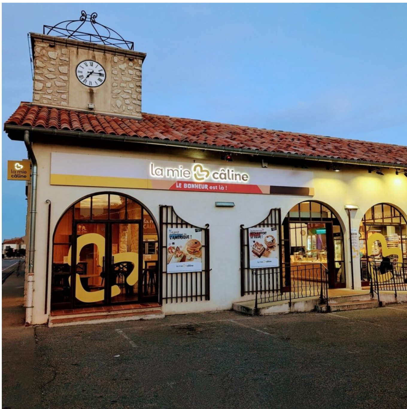
Le magasin cavaillonnais.