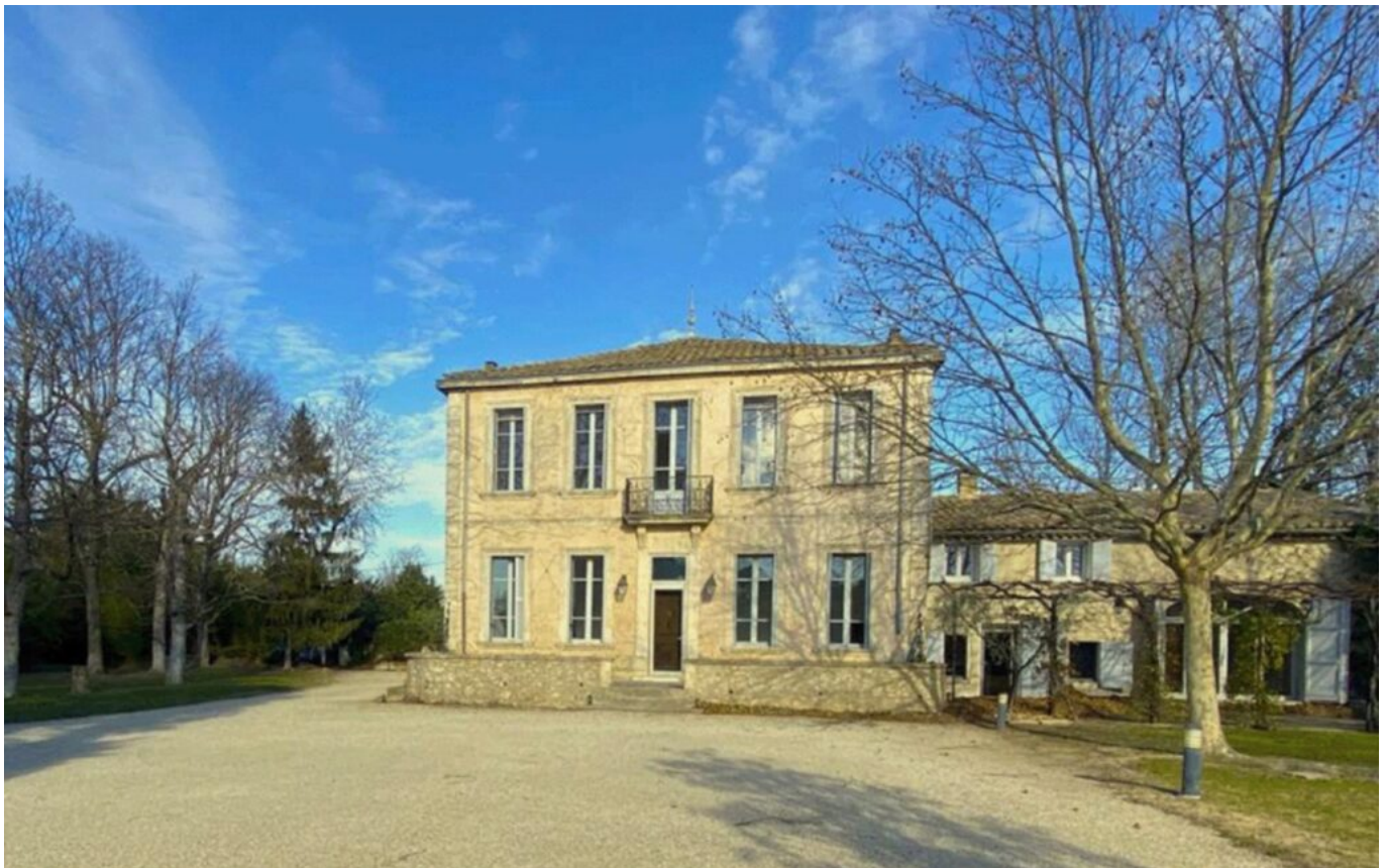
Maison partagée de Cavailon

Quant à la maison partagée de Mollégès , elle est conçue pour les personnes âgées en perte d'autonomie. Le lien social créé par la colocation appuie ainsi le travail des professionnels de santé qui suivent les résidents. Cet habitat bourgeois d'une surface de 415m 2 peut rassembler jusqu'à 9 personnes et est également équipé d'un ascenseur. Un jardin de 3000m 2 entoure la maison pour permettre les moments partagés en extérieur en toute sérénité.