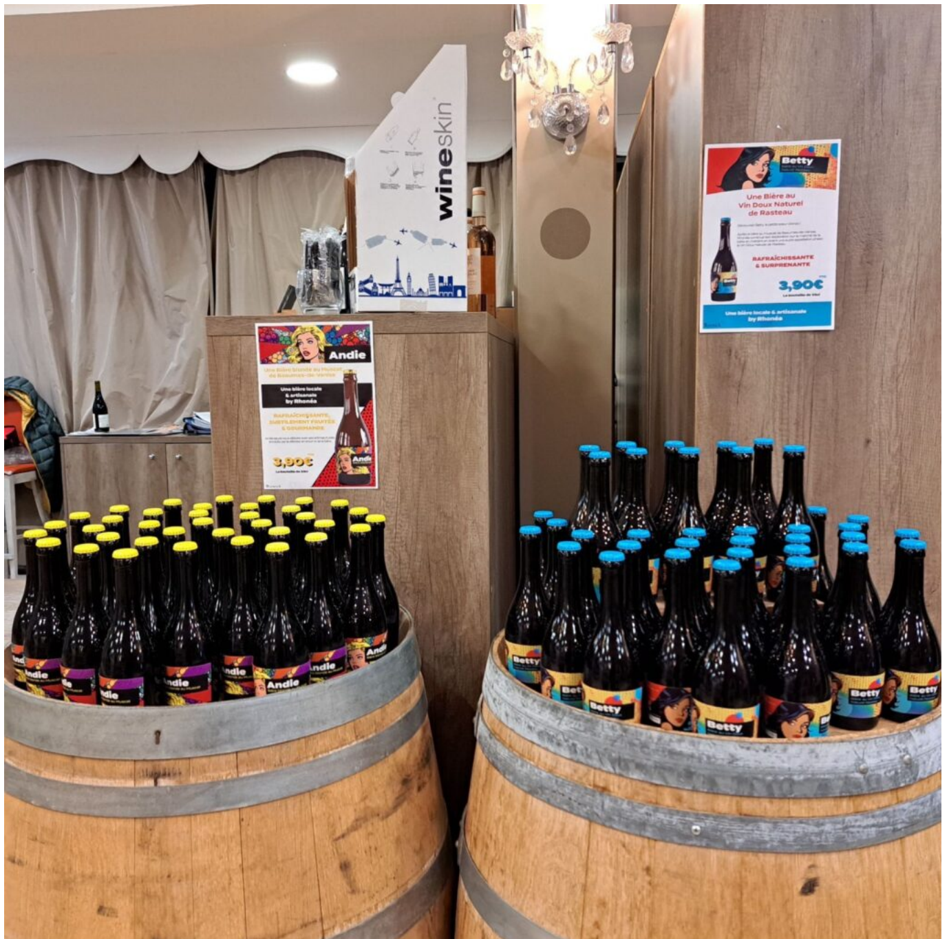
Les bière 'Andie' et 'Betty'.

Autre sujet d'actualité : les machines à désalcooliser. « Nous en avons acquis une il y a deux ans. Nous avons commencé en testant un Côte du Rhône à 11,5° qui a été apprécié, puisque 50 à 60 000 bouteilles de la Cuvée 'Les Artistes' ont été vendues entre 7€ et 8€ » précise Valérie Vincent. Lors de Wine Paris en février 2025, nous allons lancer deux autres nouveautés, l'une à 6°, l'autre à 0° d'alcool. À l'aveugle, je