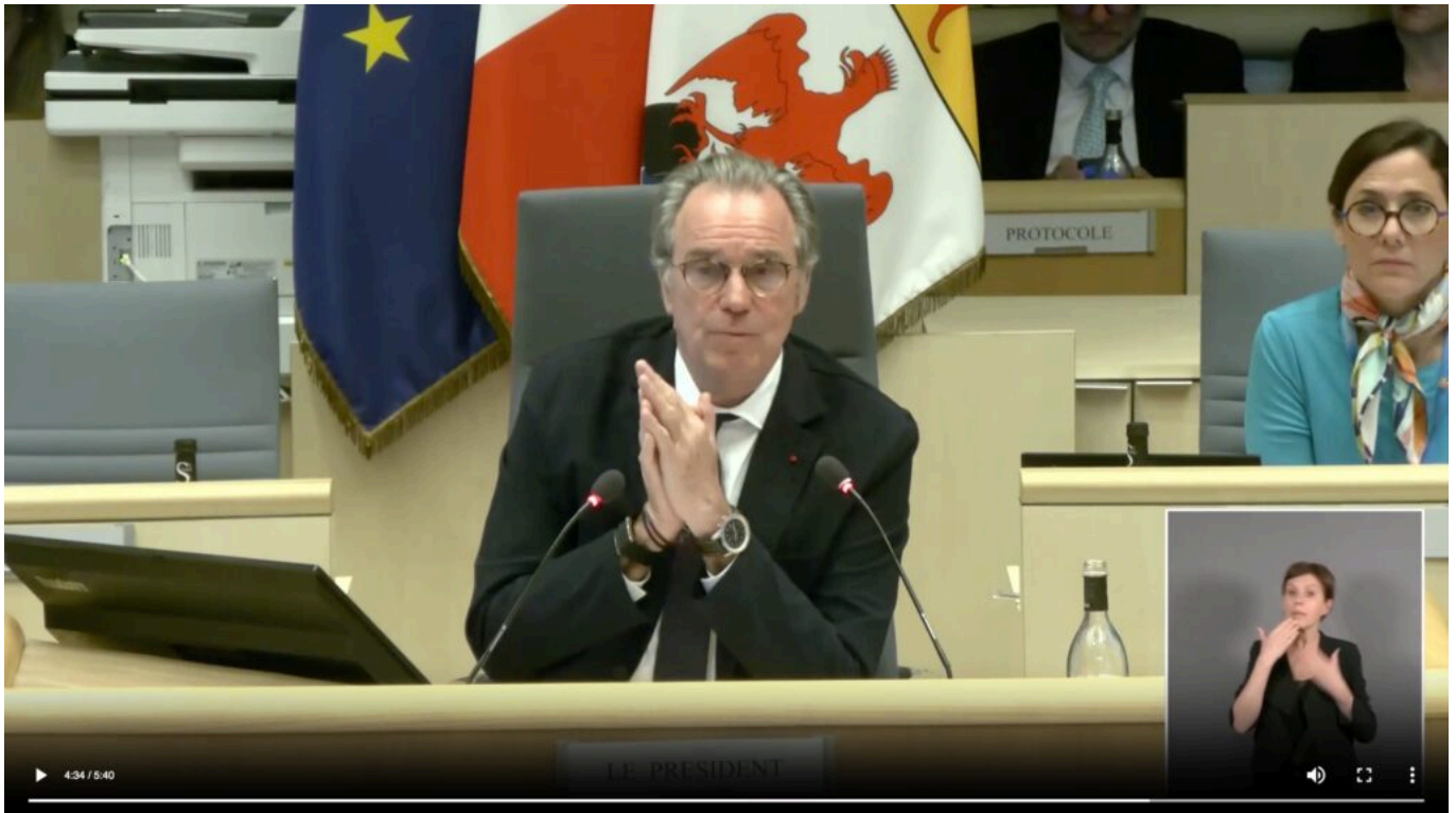
Renaud Muselier lors de la dernière séance plénière de la Région Sud.

« Il faut traiter le problème de gouvernance avant le problème de vision. »