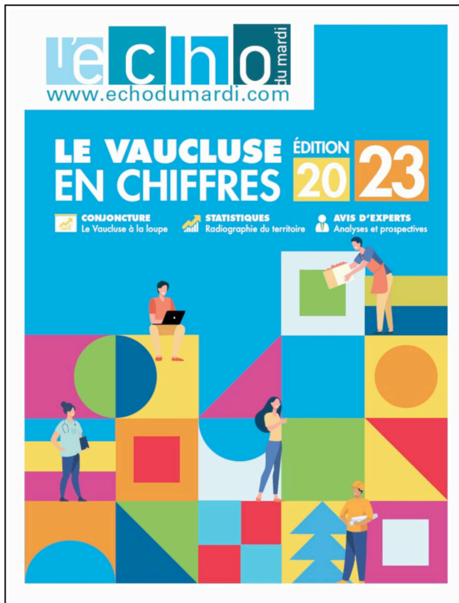
Le "Vaucluse en chiffres- Edition 2023" réalisé par L'Echo du mardi

Un chef étoilé partage son expérience avec