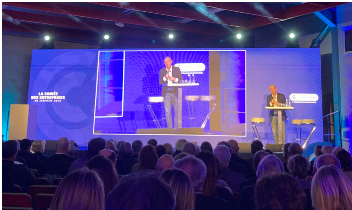
François Lenglet