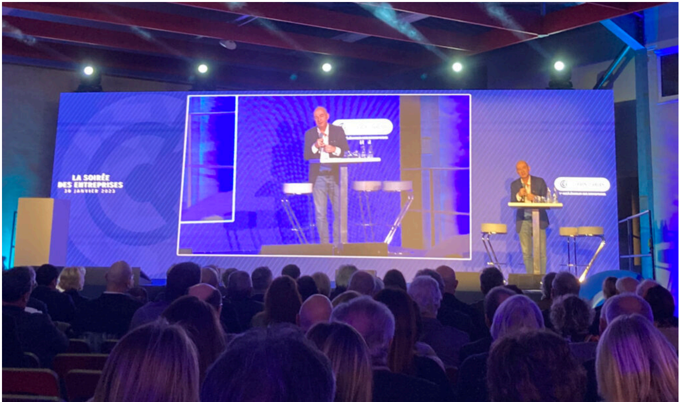
François Lenglet