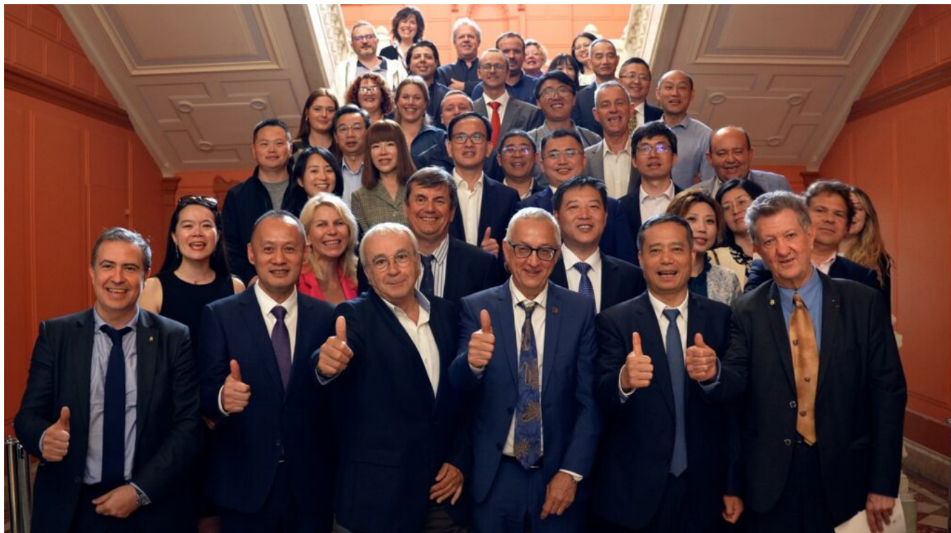
La délégation chinoise de Shenzhen lors de sa visite à la CCI de Vaucluse en octobre dernier.