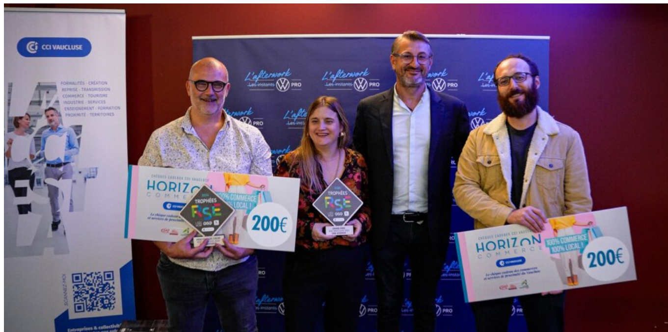
Les lauréats vauclusiens des prix RSE Vaucluse 2024.

Dans ce cadre, le chercheur met en lumière les défis de santé spécifiques aux entrepreneurs car si l'entrepreneuriat est souvent source de satisfaction, il comporte également des risques importants comme le burn-out, le stress et des problèmes de santé chroniques.