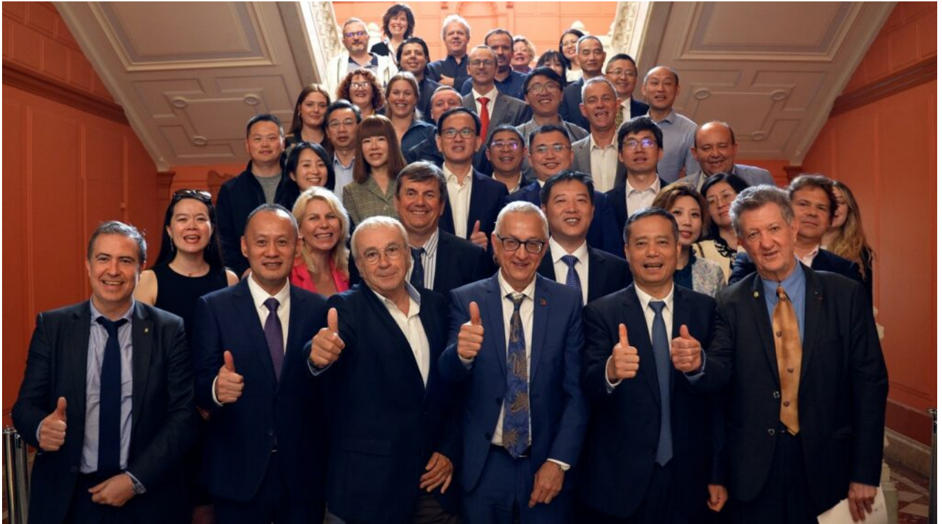
La délégation chinoise de Shenzhen lors de sa visite à la CCI de Vaucluse en octobre dernier.