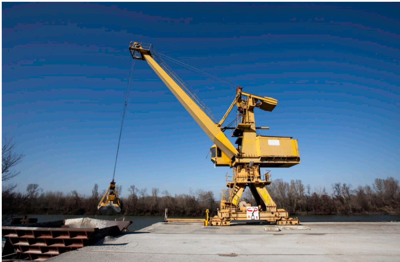
Le port fluvial du Pontet dont la CCI de Vaucluse assure la gestion.

Dans cette optique, la Chambre est ainsi à l'initiative d'un projet de transport fluvial sur le Rhône au départ du Port du Pontet.