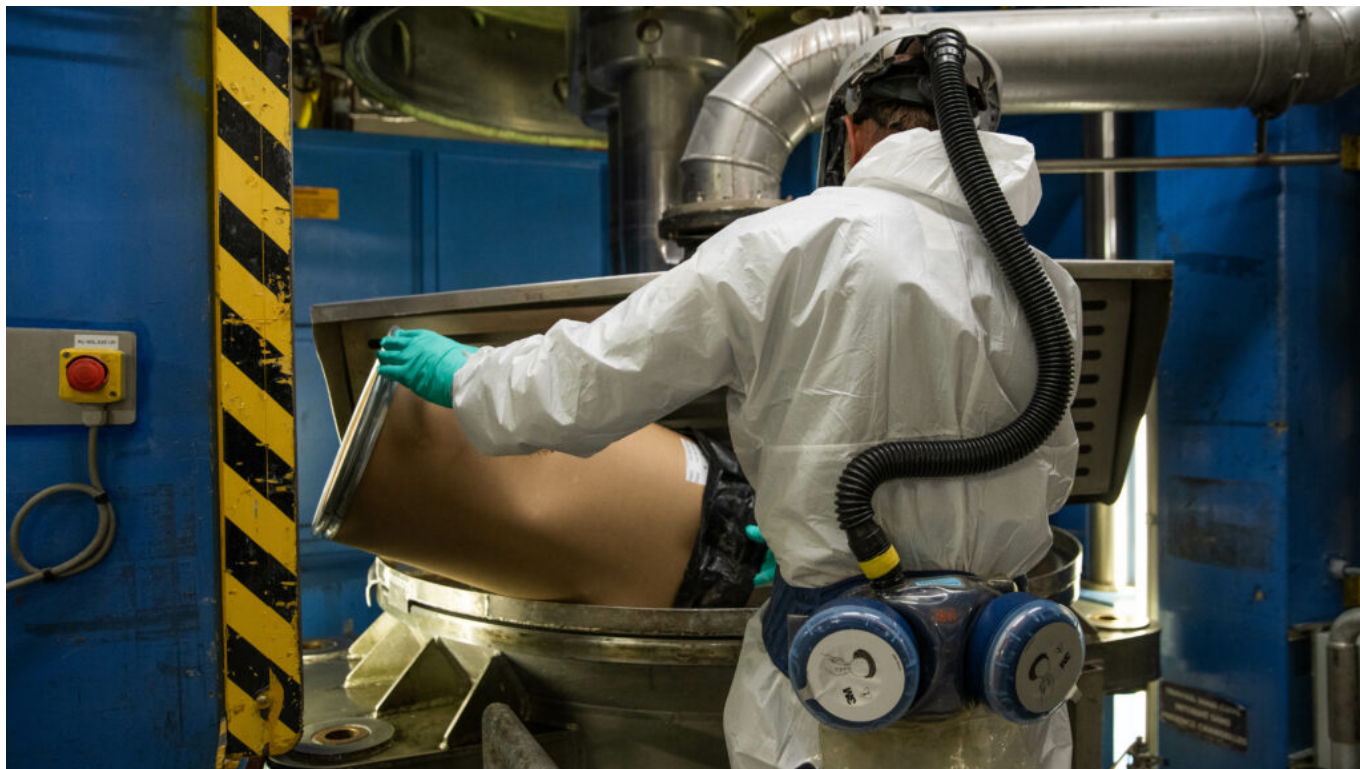
Le site de production de Sorgues du leader européen des poudres et explosifs. ©Eurengo