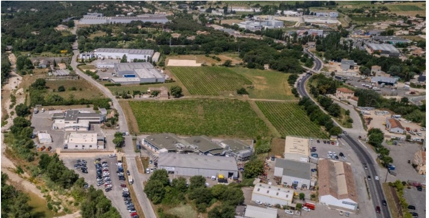
La zone industrielle Peyrolière.