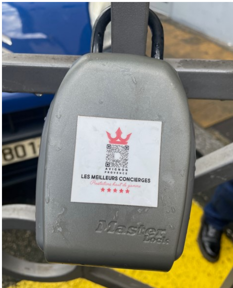
Boite à clefs