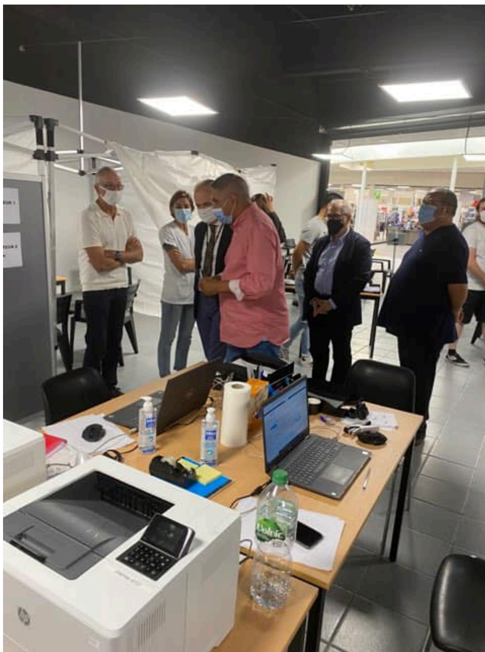
Inauguration du nouveau centre de vaccination à Carrefour Courtine.