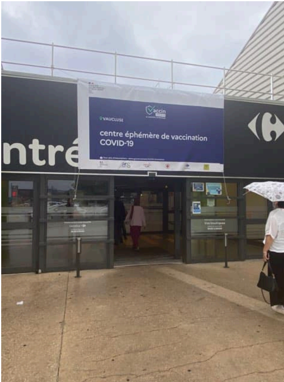
Inauguration du nouveau centre de vaccination à Carrefour Courtine.