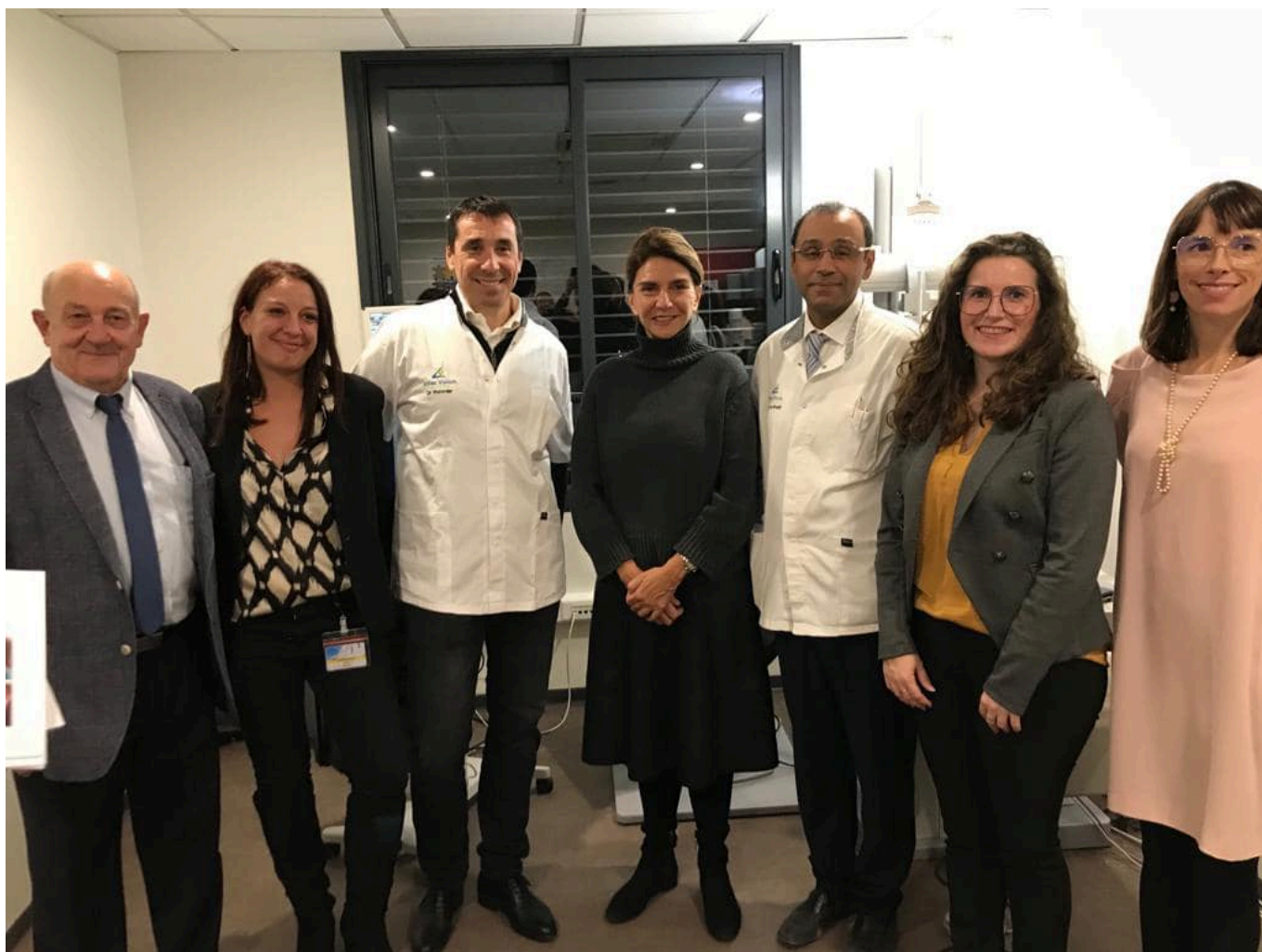
Les différents acteurs qui ont contribué à la création de ce centre ophtalmologique en télémedecine.