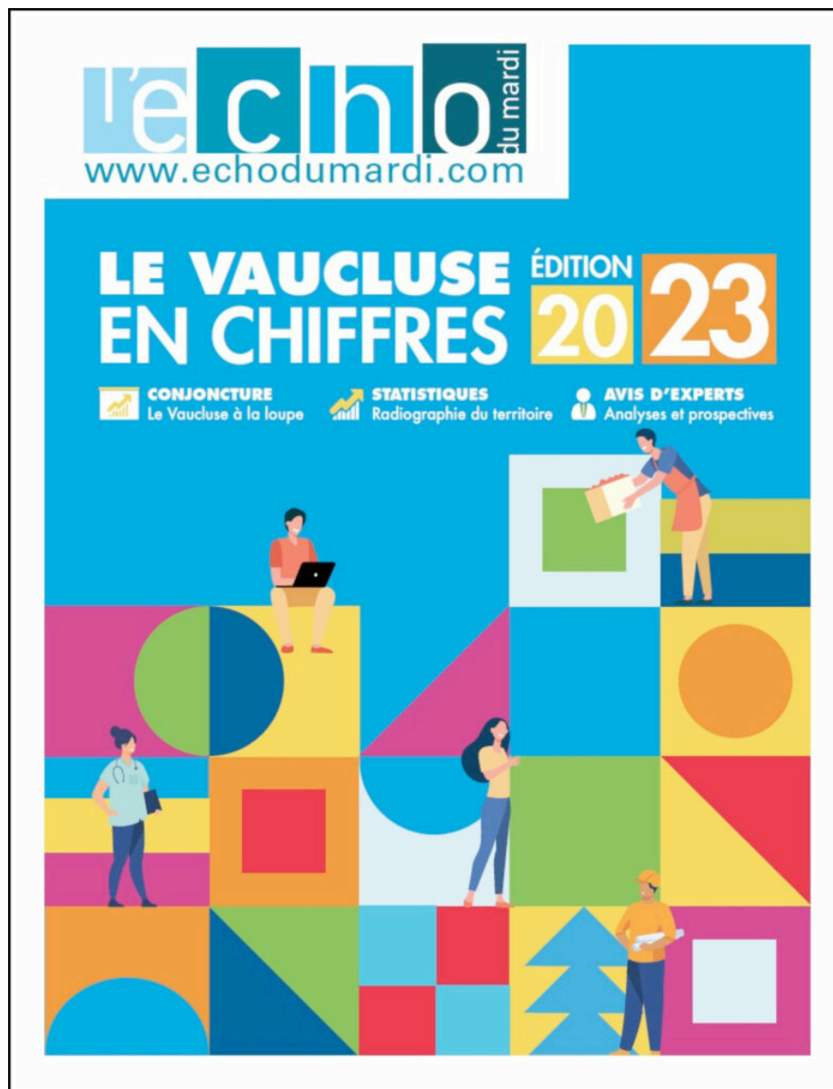
Le "Vaucluse en chiffres- Edition 2023" réalisé par L'Echo du mardi

« Stars & Métiers » : l'excellence de la