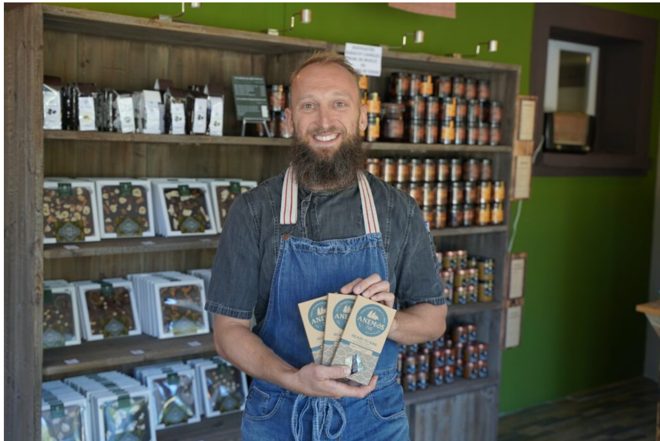
Marc Chaloin © CMAR

forme, frais et dispos ». Le bien-être au travail fait partie de son crédo d'entrepreneur engagé ».