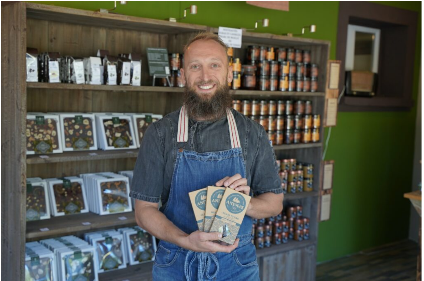
Marc Chaloin © CMAR

forme, frais et dispos ». Le bien-être au travail fait partie de son crédo d'entrepreneur engagé ».