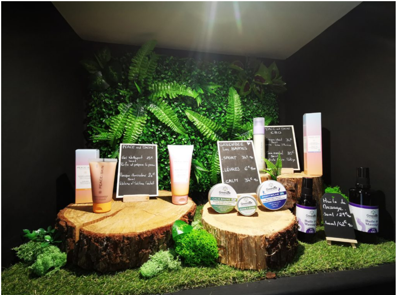
La gamme cosmétique, soin, massage, masque, baumes. Crédit photo: Linda Mansouri