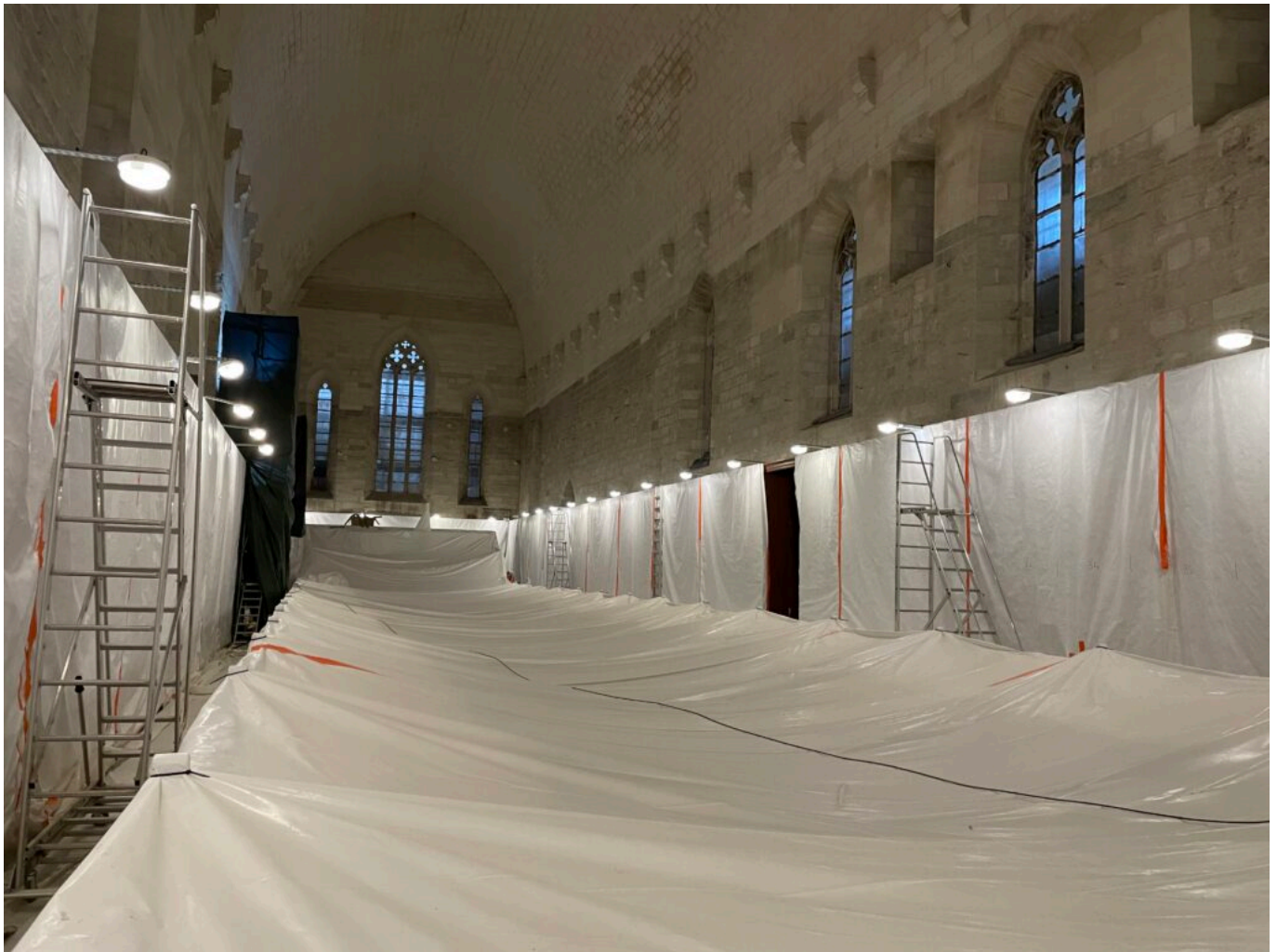
La Chapelle Benoit XII entièrement bâchée