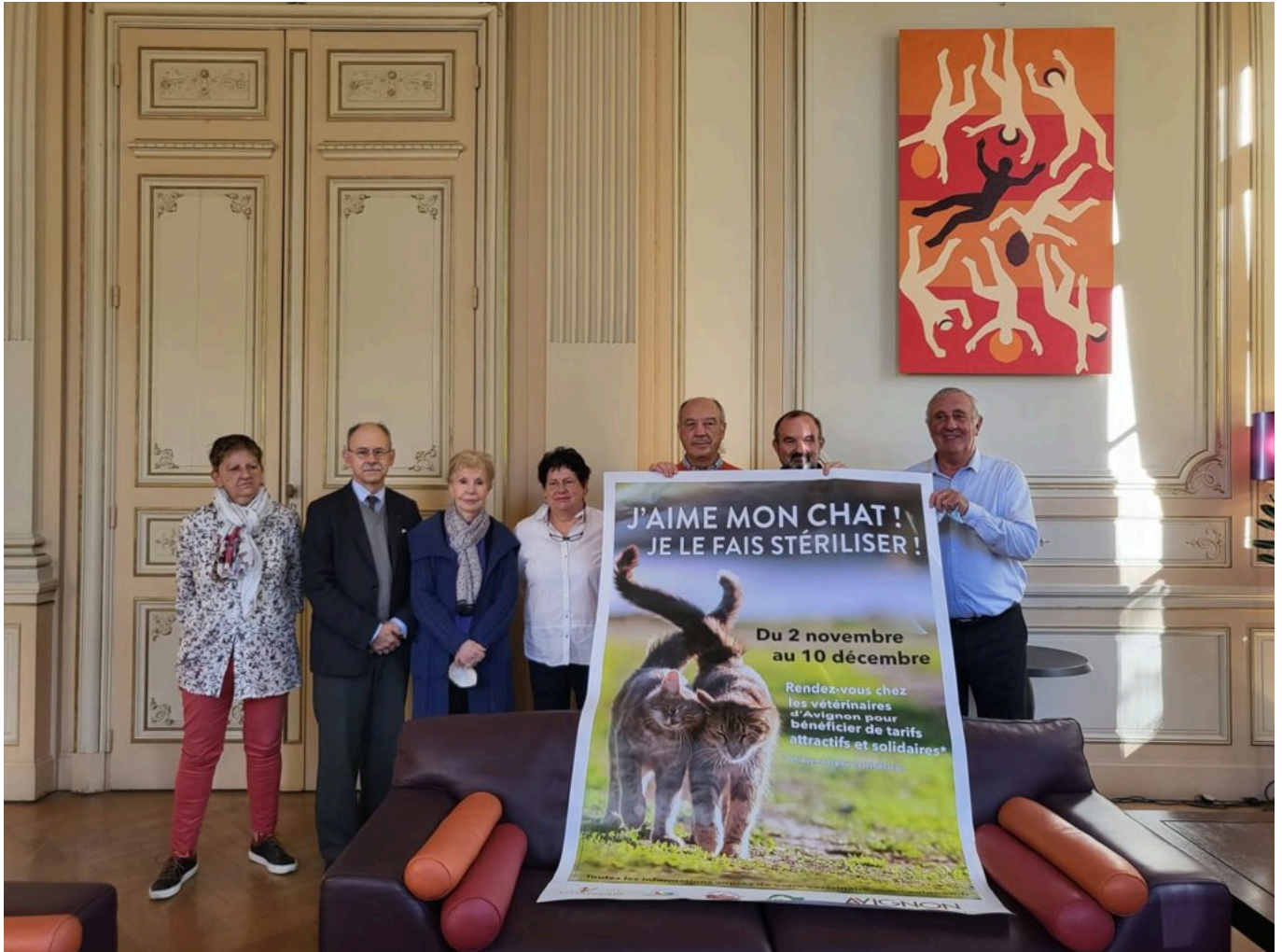
Annonce de la campagne de stérilisation.