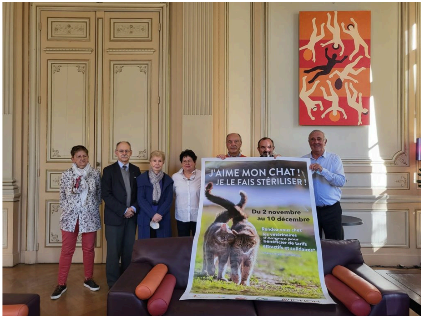
Annnonce de la campagne de stérilisation.