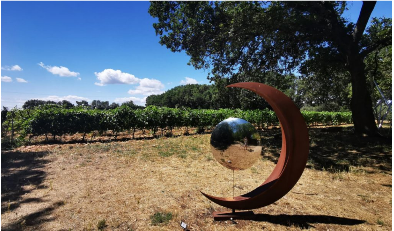
Château de Bosc