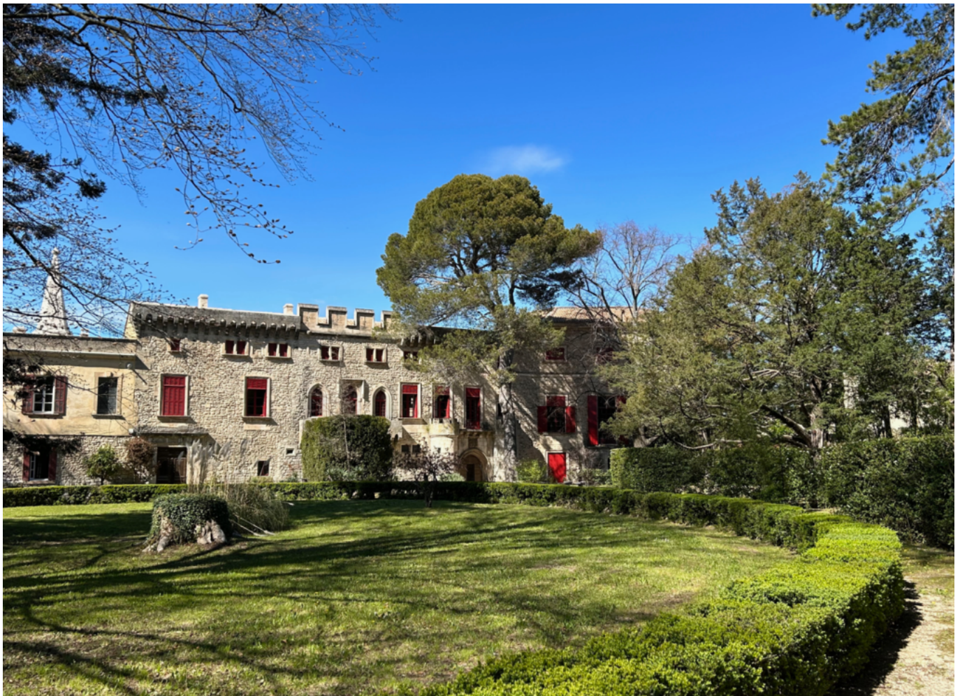
Le Château de Thézan, côté Parc