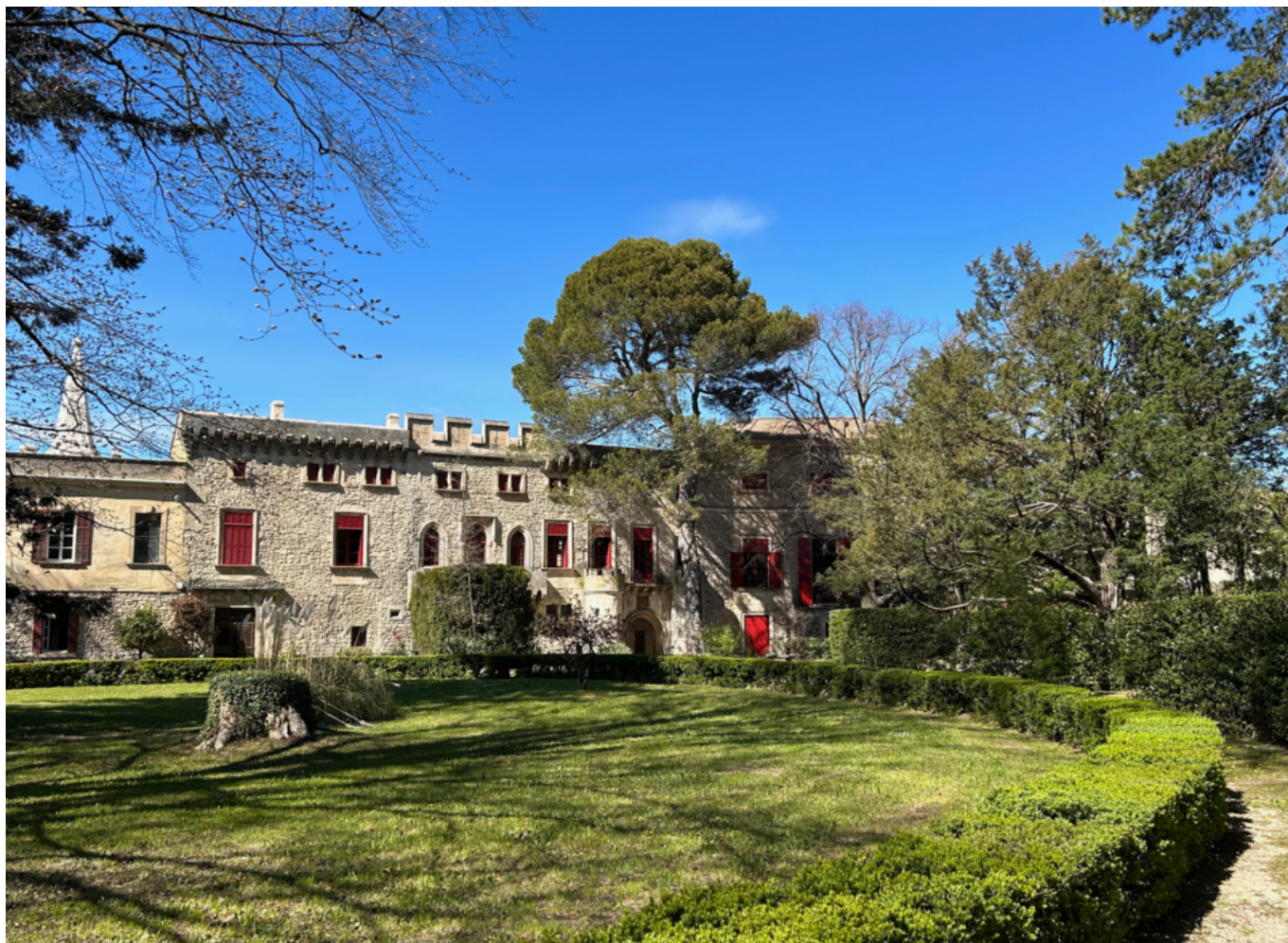
Le Château de Thézan, côté Parc