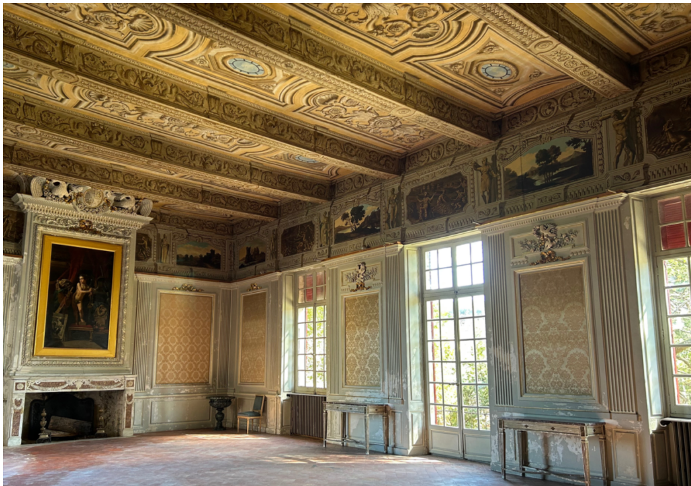
la salle de bal