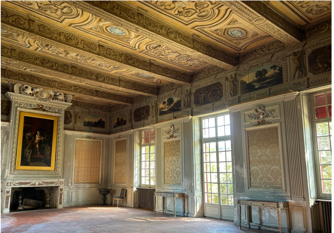
la salle de bal