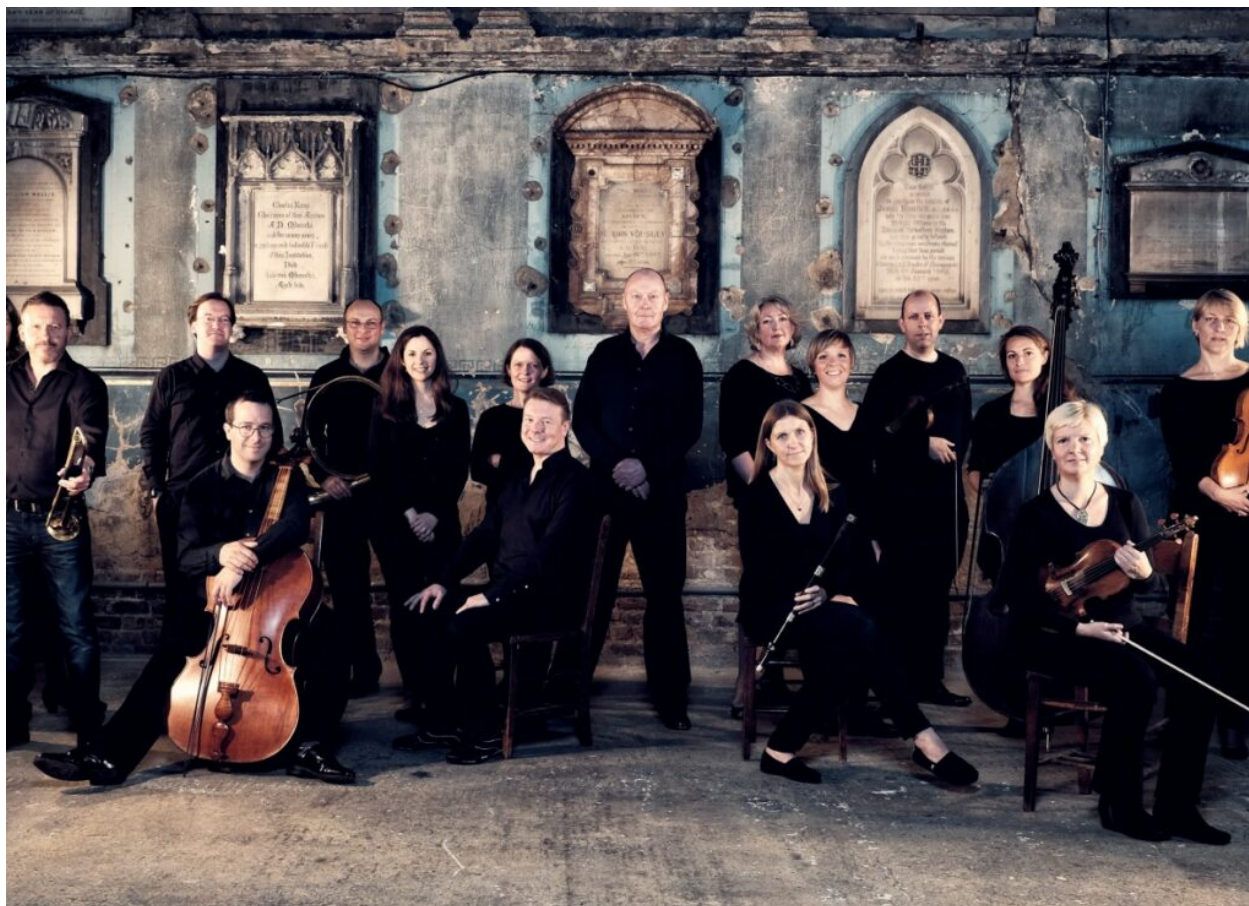
«King Arthur» par le Gabrieli Consort le 09 juillet place de l'Horloge à Ménéribes