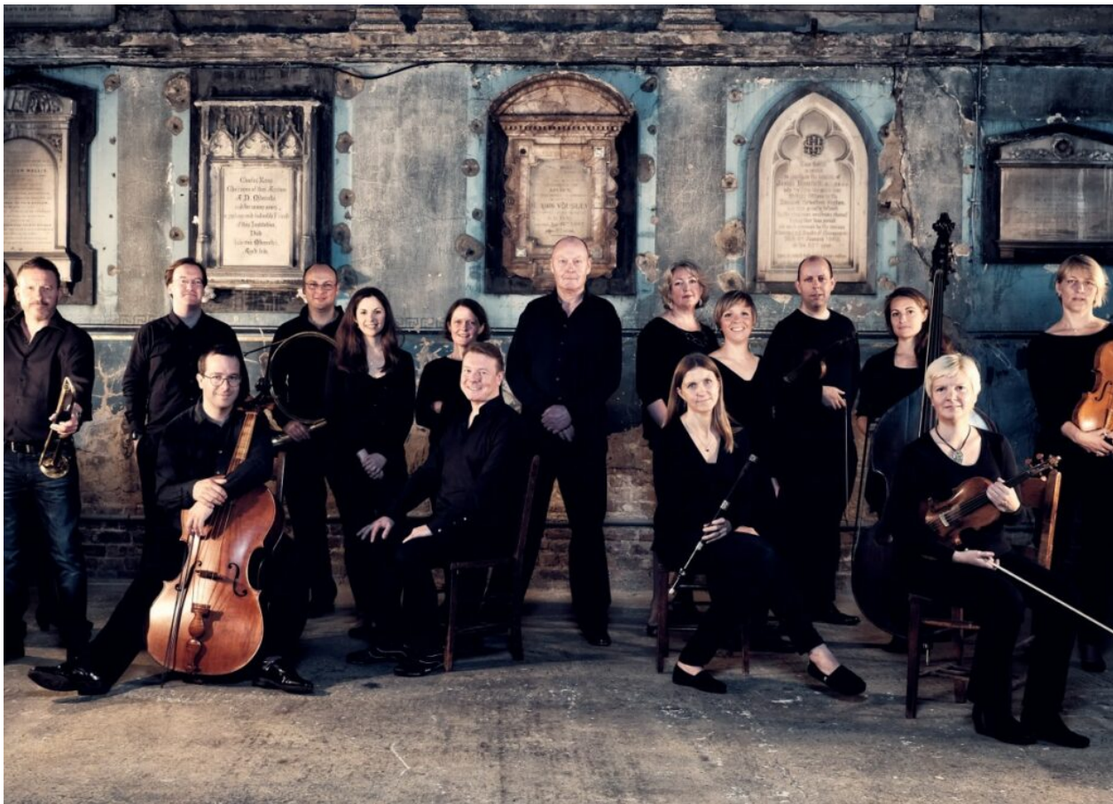
“King Arthur” par le Gabrieli Consort le 09 juillet place de l'Horloge à Ménerbes

A Ménerbes le 9 juillet, mais en plein air sur la Place de l'Horloge l'opéra « King Arthur » de Purcell qui sera dirigé par le londonien Paul Mac Creesh à la tête de son Ensemble Gabrieli Consort & Players et de sopranos, ténors baryton et baryton-basse réputés.