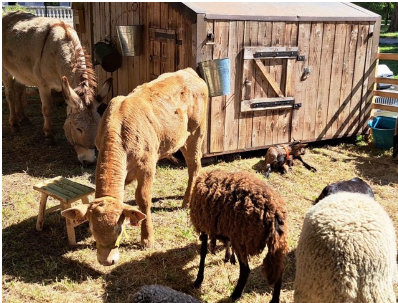
La ferme pédagogique