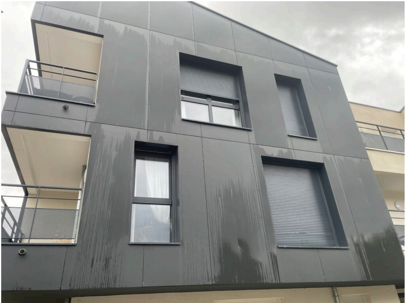
Mon appart', Nouveau Chai 2.