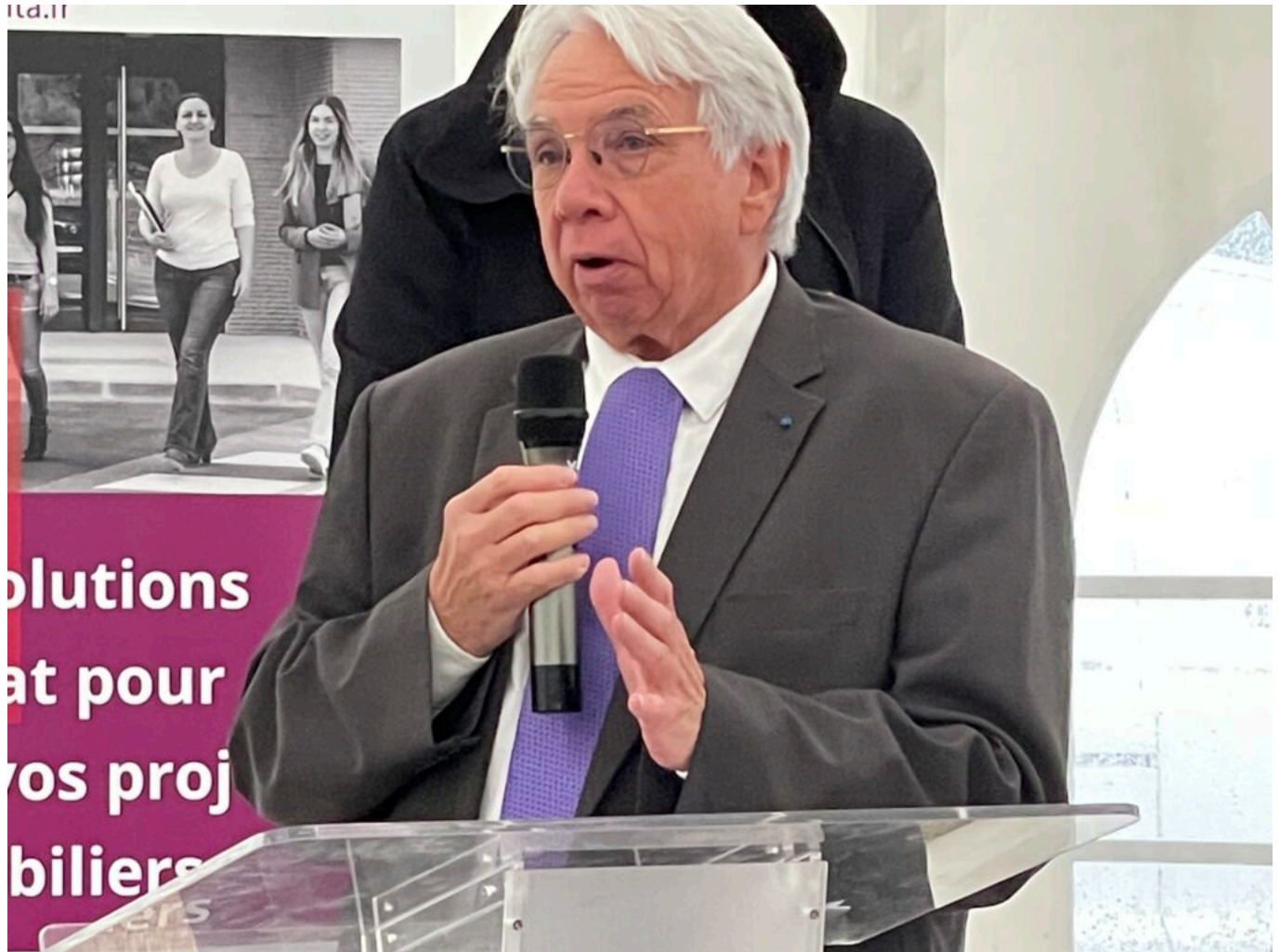
Michel Gontard Copyright MMH