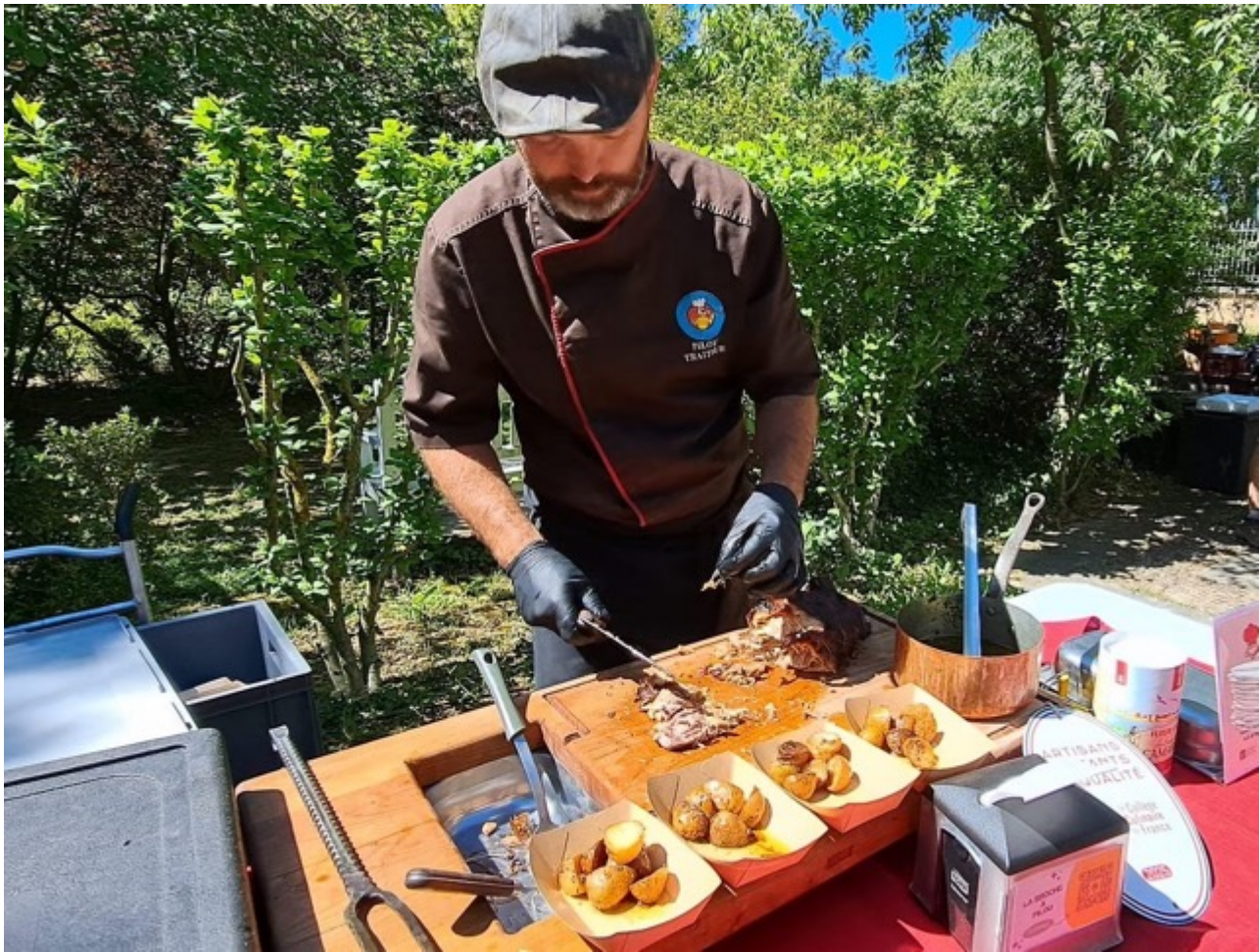
La Broche à Pilou