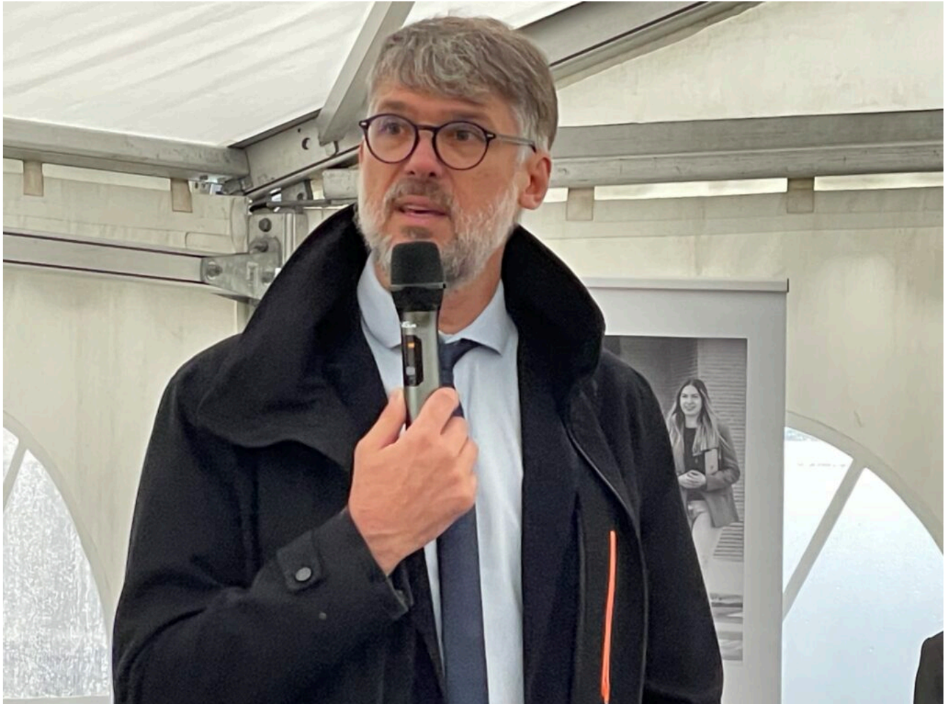
Etienne Klein