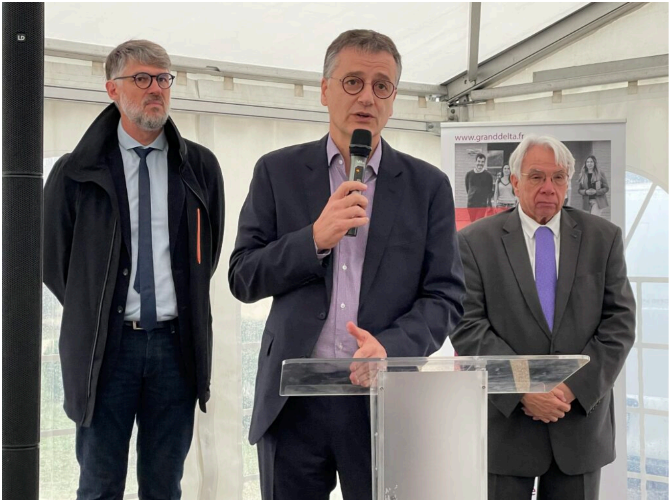
Nicolas Gravit, Président national de l'Unam

La force du projet réside dans sa capacité à proposer une mixité sociale réelle, avec 42 logements sociaux, des appartements en accession aidée grâce au PSLA (Prêt Social Location-Accession), et d'autres en vente libre ou en dispositif Pinel. Une diversité rendue possible par la maîtrise d'ouvrage de notre coopérative qui agit depuis près de 60 ans au service de l'habitat pour tous. Le programme 'Mon Appart', avec ses 39 logements baignés de lumière et ses prestations énergétiquement performantes (chauffage par pompe à chaleur, ballons thermodynamiques, panneaux rayonnants...), incarne cette volonté de proposer un habitat durable, sans renier le confort moderne. Le tout à des prix abordables : un T2 à partir de 124 500 €, un T3 à 145 000 €. Avec ses bâtiments R+2, ses jardins privatifs, ses stationnements végétalisés et ses équipements durables, le quartier parvient à mêler cohérence urbaine et qualité paysagère. Nous avons pensé ce quartier dans une logique de densité douce et respectueuse. Près de 72 % des logements sont individuels, et tous répondent aux besoins de la population locale. »