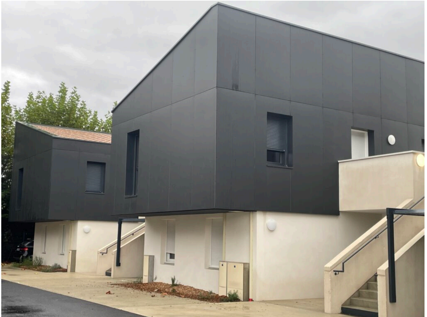
Nouveau Chai 2

000€. Chaque logement a été vendu avec au minimum une place de stationnement. Le chauffage est électrique et l'eau chaude produite par un ballon thermodynamique.