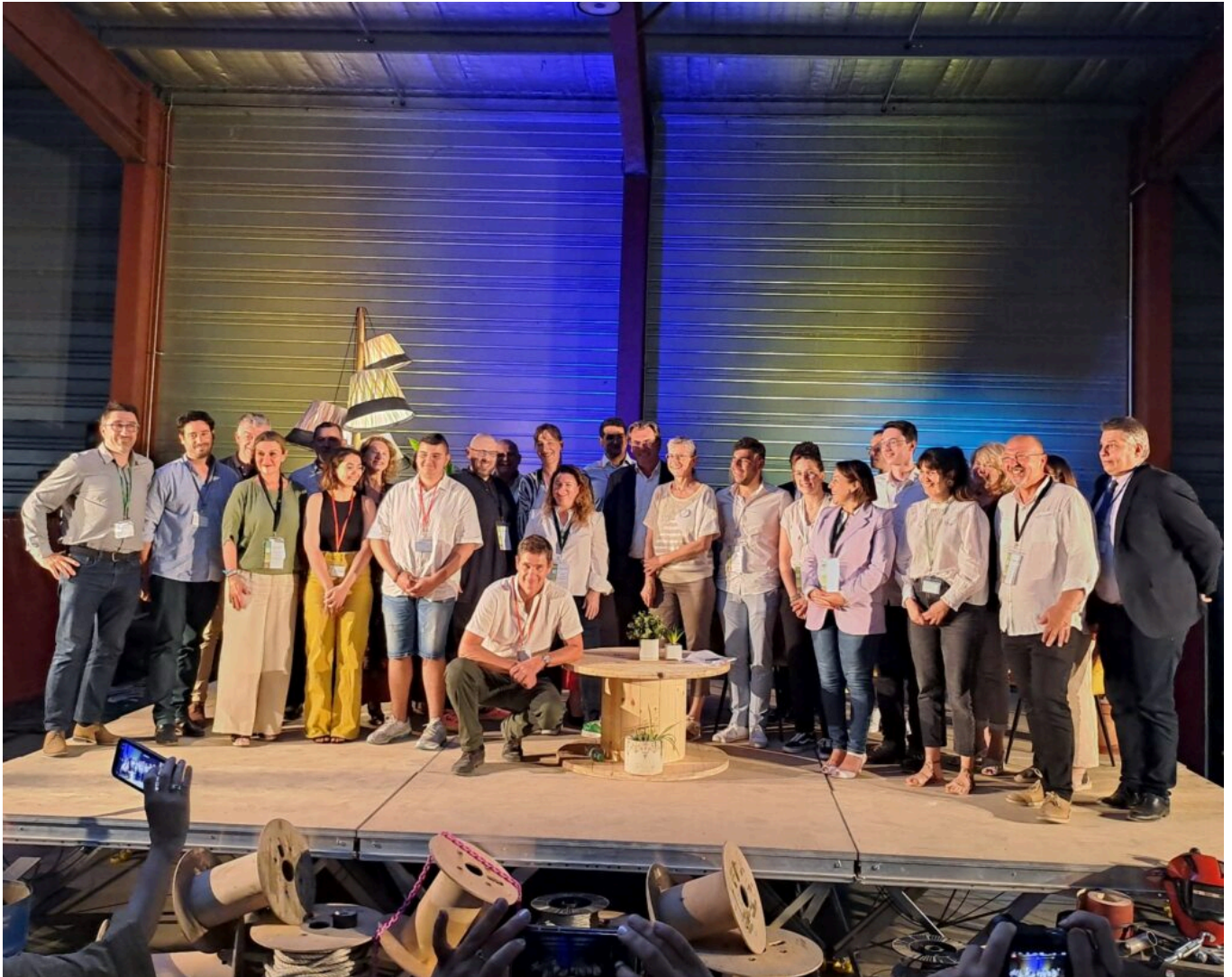
Les intervenants et animateurs de la soirée.