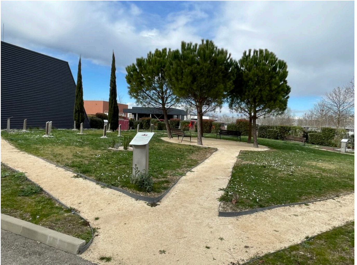
Le jardin du souvenir