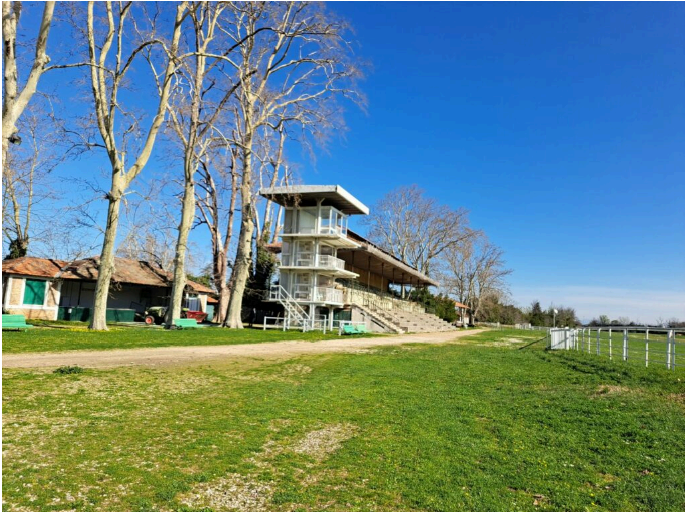
Les tribunes classées Monuments Historiques en 1993

des paddocks. Ils ne comptent pas leurs heures, tous ces bénévoles passionnés. Mais depuis des années, l'état de Roberty se dégrade. Il date de 1868, ses tribunes et anciens haras ont été classés Monuments Historiques en 1993. Il est aussi labellisé 'Unité de Zone Verte', un poumon d'oxygène en milieu urbain avec ses 125 ha de verdure.