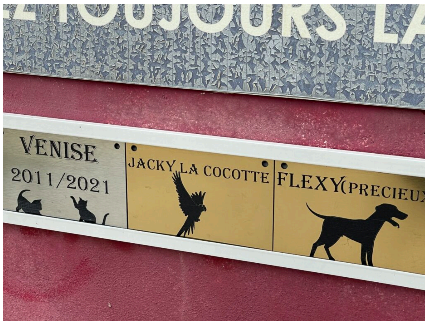
Le mur du souvenir