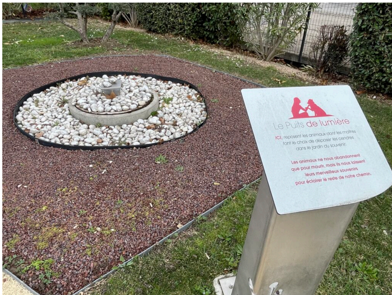
Le jardin du souvenir