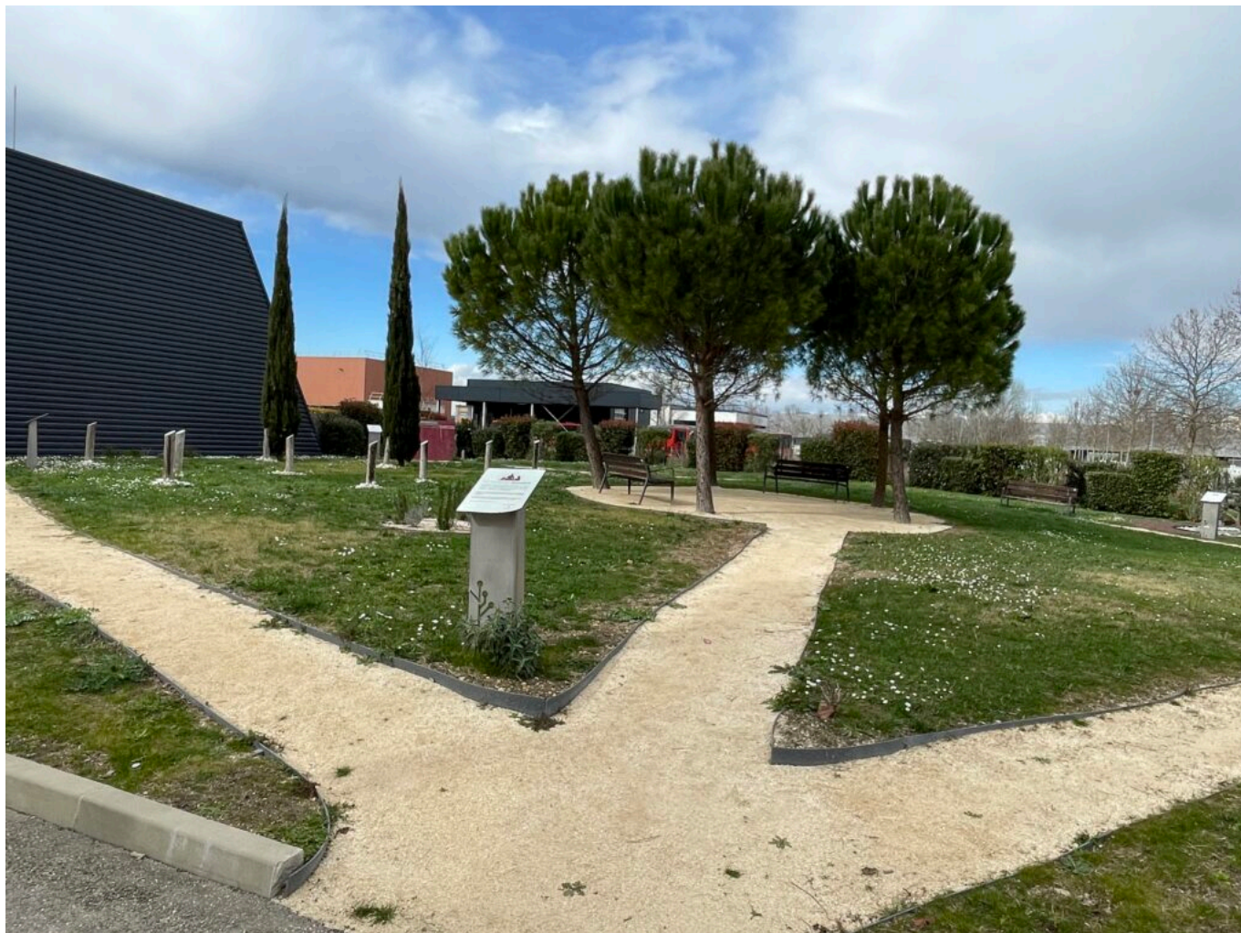
Le jardin du souvenir

Chateauneuf-de-Gadagne, urgent, venez témoigner de vos balades dans et autour du