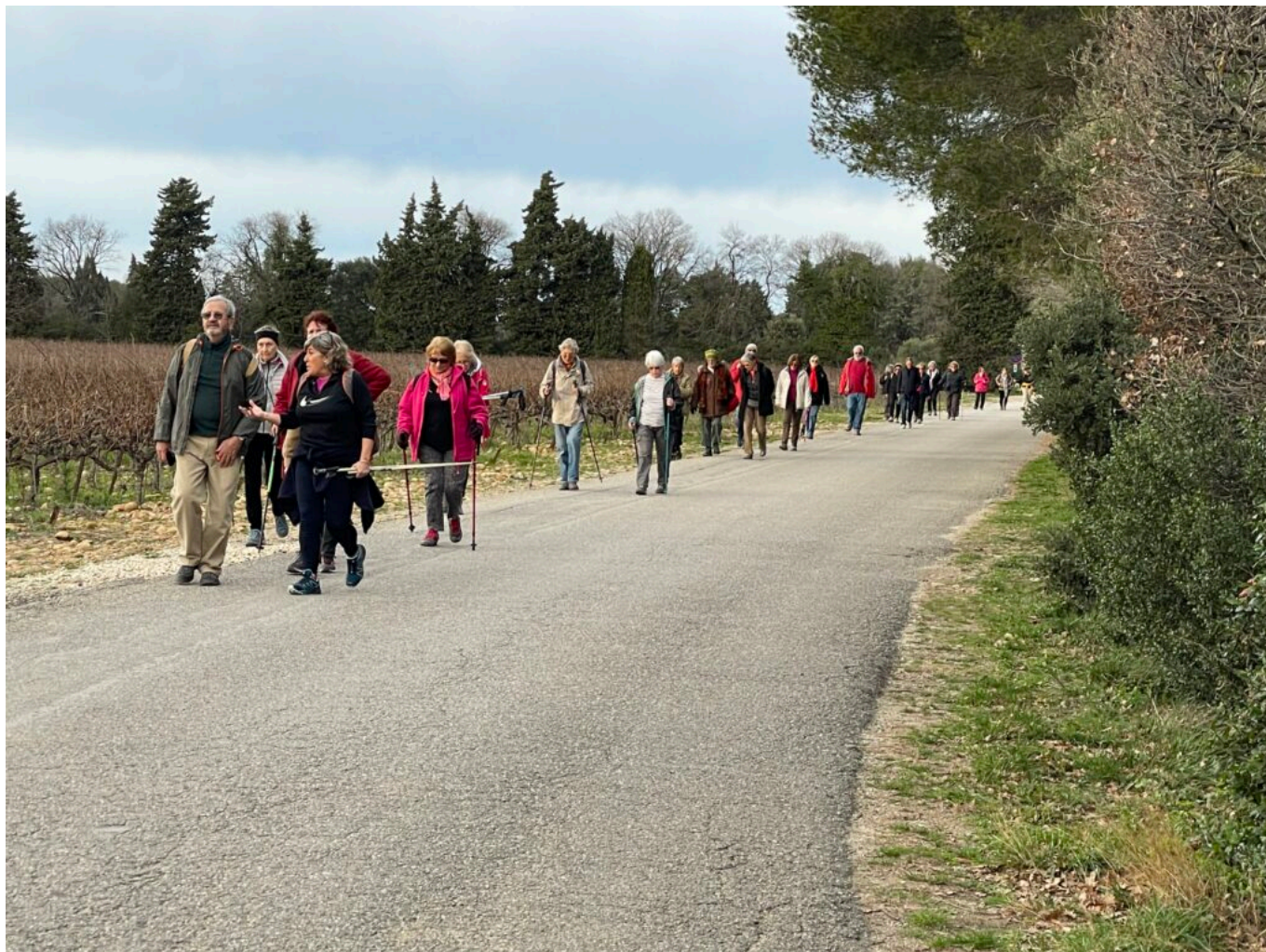
Les marcheurs à Chateauneuf-de-Gadagne